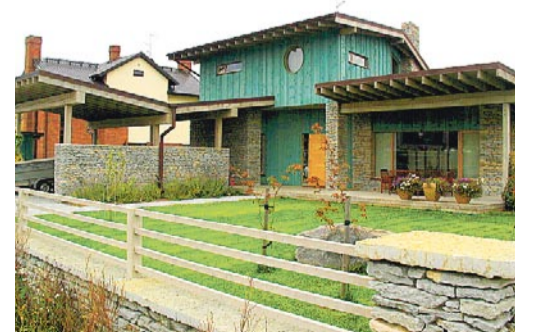
Kivineeme tee 14