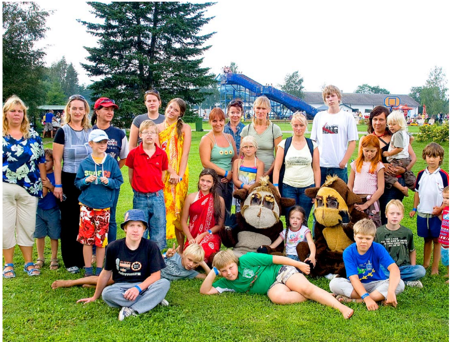
Invaühingu lapsed ootasid Vembu-Tembumaale minekut terve aasta.