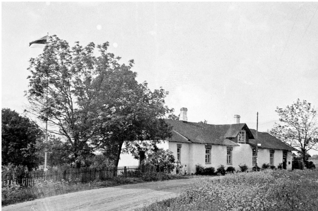
Viimsi vallamaja 1930. aastatel, Hans Sardi foto.

Seekordse lehenäitusega oleme jõudnud Miiduranna külla.