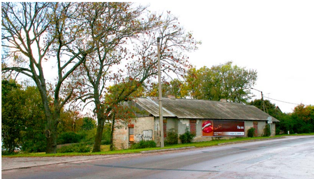
Endine vallamaja 2007.

Tänapäeval on Ranna tee 3 nime kandev hoone, rahva seas tuntud ka kui Miiduranna barakk, ohus Ranna tee laiendamise tõttu, mille käigus on plaanitud maja lammutada.