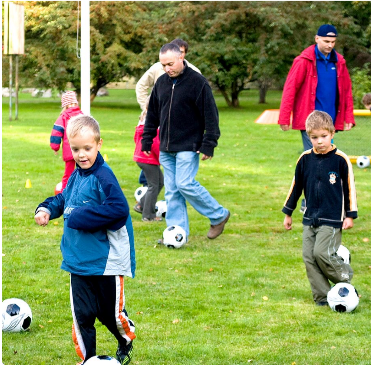
Laste treeninguid tuleb rikastada põnevate mängudega.

Piilupesa esimesed üritused jalgpalli edendamise projektis toimusid lasteaias spordiväljakul 20. ja 21. septembril. Alustasime kell pool kuus õhtul, et muuta üritus lapsevanematele ajalisel sobivaks. Nendel päevadel said uhiuute pallidega mängida sügisel kooliminevad lapsed ning nende vanemad. Kuid juba suutsime huvi äratada ka nooremate seas,