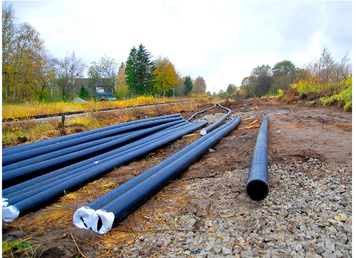
Metsakasti külla paigaldatakse uued reoveetorud.

Järgnevalt on kavas korraldada rahvusvahelised hanked Randvere ja Tammneeme küla vee- ja reoveetorustike rajamiseks. Plaanitud on rajada torustikud Randvere külas järgnevatele tänavatele: Kibuvitsa tee, Nõmmeliiva tee,