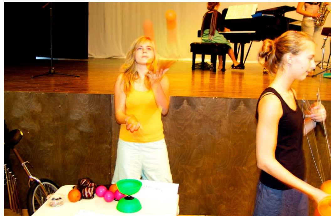
Esiplaanil tüdrukud trupist OMATSirkus, taamal Viimsi muusikakooli džässorkester.

Väga populaarne oli laadal koolivormi väljapanek, kuhu kogunes palju huvilisi ja ostjaid. Kaasa sai tuua kasutatud koolivormi ja see lihtsalt ära anda või müüa. Vanemad avaldasid arvamust, et selline võimalus on hea, sest lapsed kasvavad kiiresti ning uut rõivaset ei jõua korralikult kandagi, kui see juba väikeseks jääb. Tänuilike lapsevanemaid, kel õnnestus kerge vaevaga vajalik riideese soetada, oli palju.