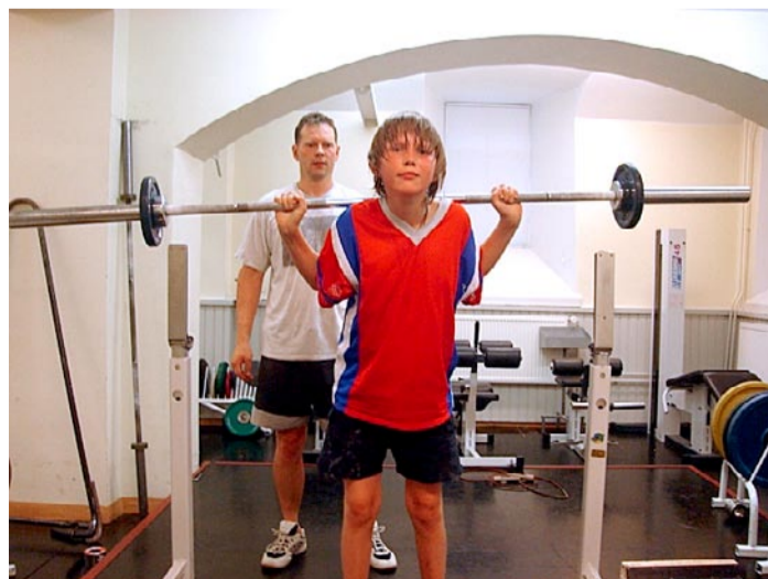
Isa julgustab poega spordiga tegelema

Kuid mina mõtlesin õhtul enne uinumist, mida saaksin oma sõbranna pere heaks teha.