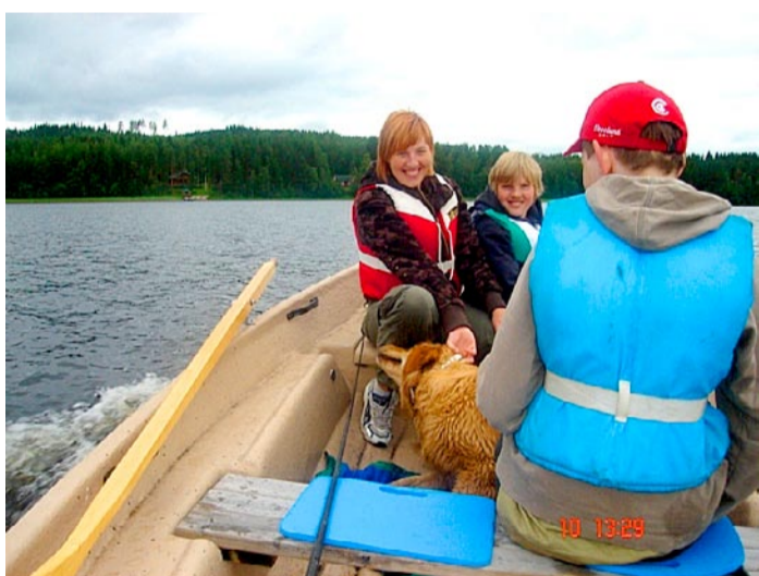
Paadisõit on saanud pere lemmiktegevuseks