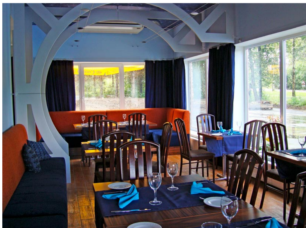
Uues ehitises asuv maast-laeni akendega restoran on valgusküllane ning õhuline

Interjööri on temaatilise, seintel võib näha fotosid džässartistidest, värvivalik ja sisustus toetavad hubase klubi ideed. Frank Sinatra pilte võib näha seintel, samuti aitab tema muusika kaasa restorani miljöö loomisel. Põhisaalis asuval esinemislaval troonib klaver, millel reede ja laupäeva õhtul musitseerivad artistid, kelle seas on ka Georg Otsa muusikakooli