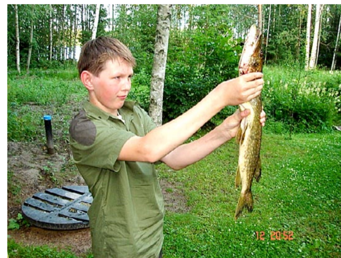
Steni lemmikhobi on kalapüük. Meele teeb eriti rõõmsaks edukas kalalkäik

Kui teie tutvusringkonnas on peresid, kus kasvab raske haiguse või puudega laps, siis