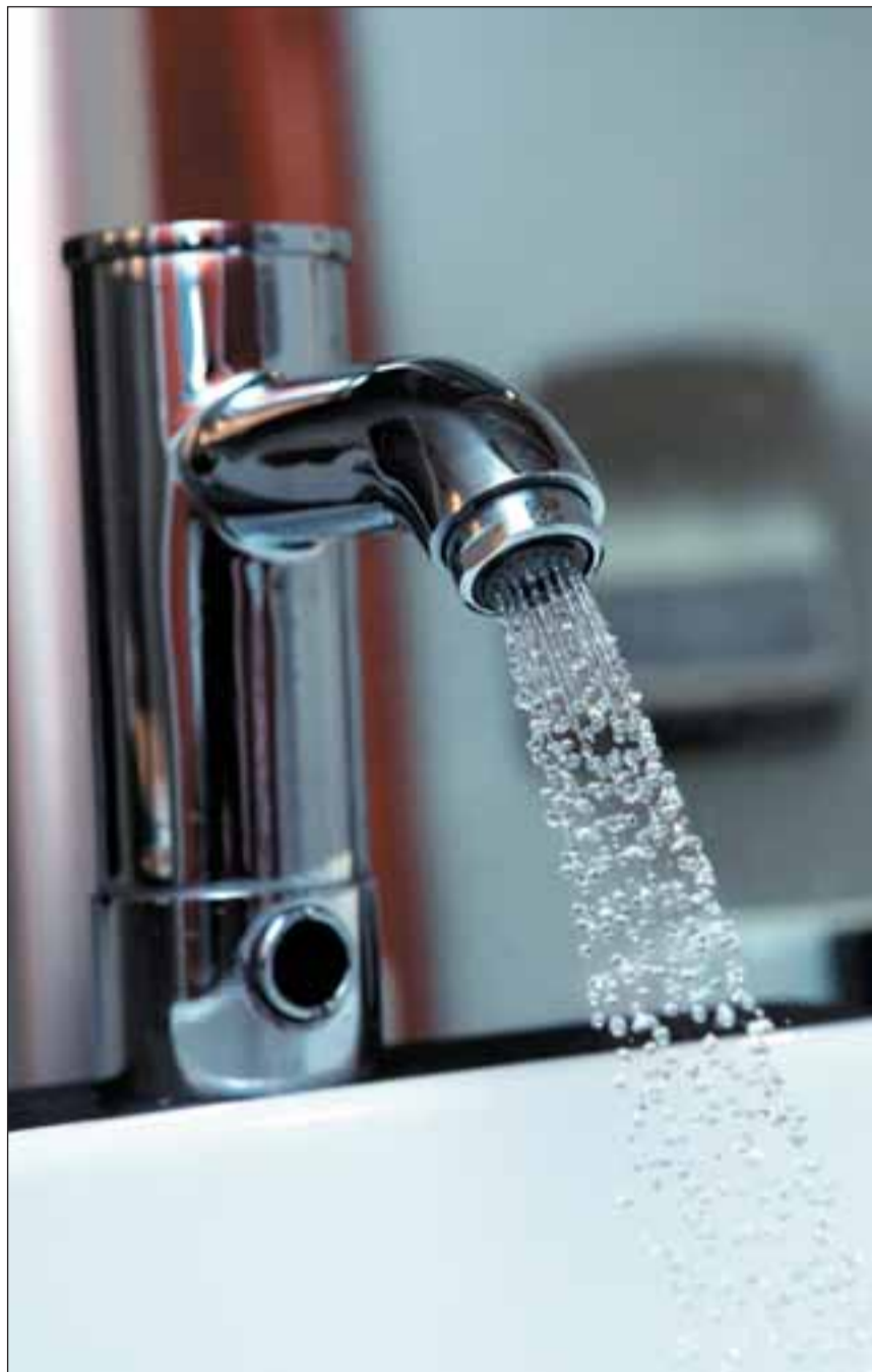
Lähimate aastate jooksul saab Viimsi tänapäevase ning euronormidele vastava veevarustussüsteemi, mis tähendab ka kvaliteetset joogivett.

Hundi tee torustike rajamine tuleneb vajadusest teostada lisaks teekatte ning tänavavalgustuse ehitust. Teekatte hilisem rikkumine viie aasta jooksul on ees-