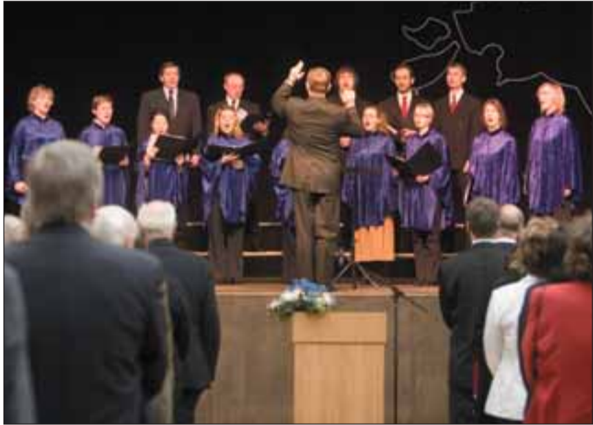
Eesti hümnit laulis EELK Viimsi Püha Jaakobi koguduse kammerkoor.