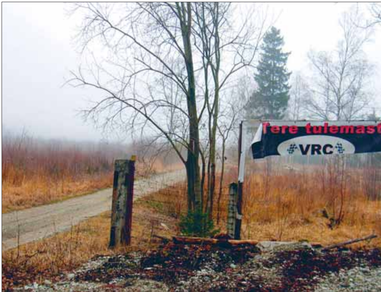
Detailplaneeringu algatamisest kinnitamiseni kulub palju aega ja asjaajamist.

Siis müüdi nimetatud kinnistu edasi ja alustati ka uute ideede ja eskiiside pakkumist, läbirääkimisi ja konsultatsioone volikogu komisjonide tasandil eesmärgiga algatada uus detailplaneering. Korrusmajade ideest olid uued omanikud loobunud ja see lõi üldse võimaluse asja edasi arutada. Mingil hetkel jõuti nii kaugele, et volikogu oli valmis detailplaneeringu algatamise ja lähteülesande kinnitamise küsimuse oma päevakorda võtma.