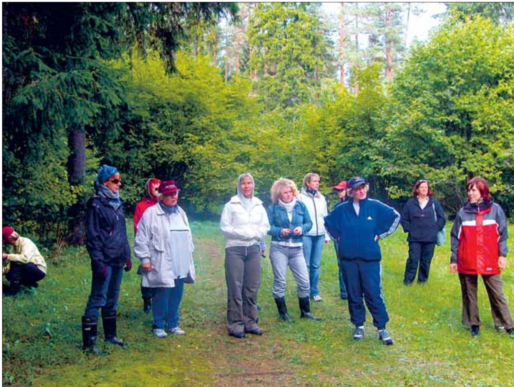
VEDA ürituste seas on kindel koht ka matkapäevadel.