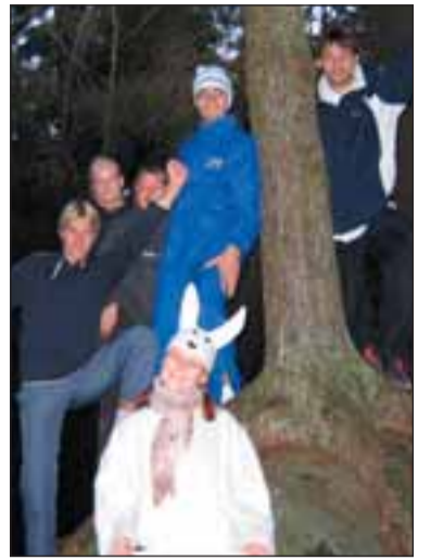
Võitjavõistkond esimeses kontrollpunktis.