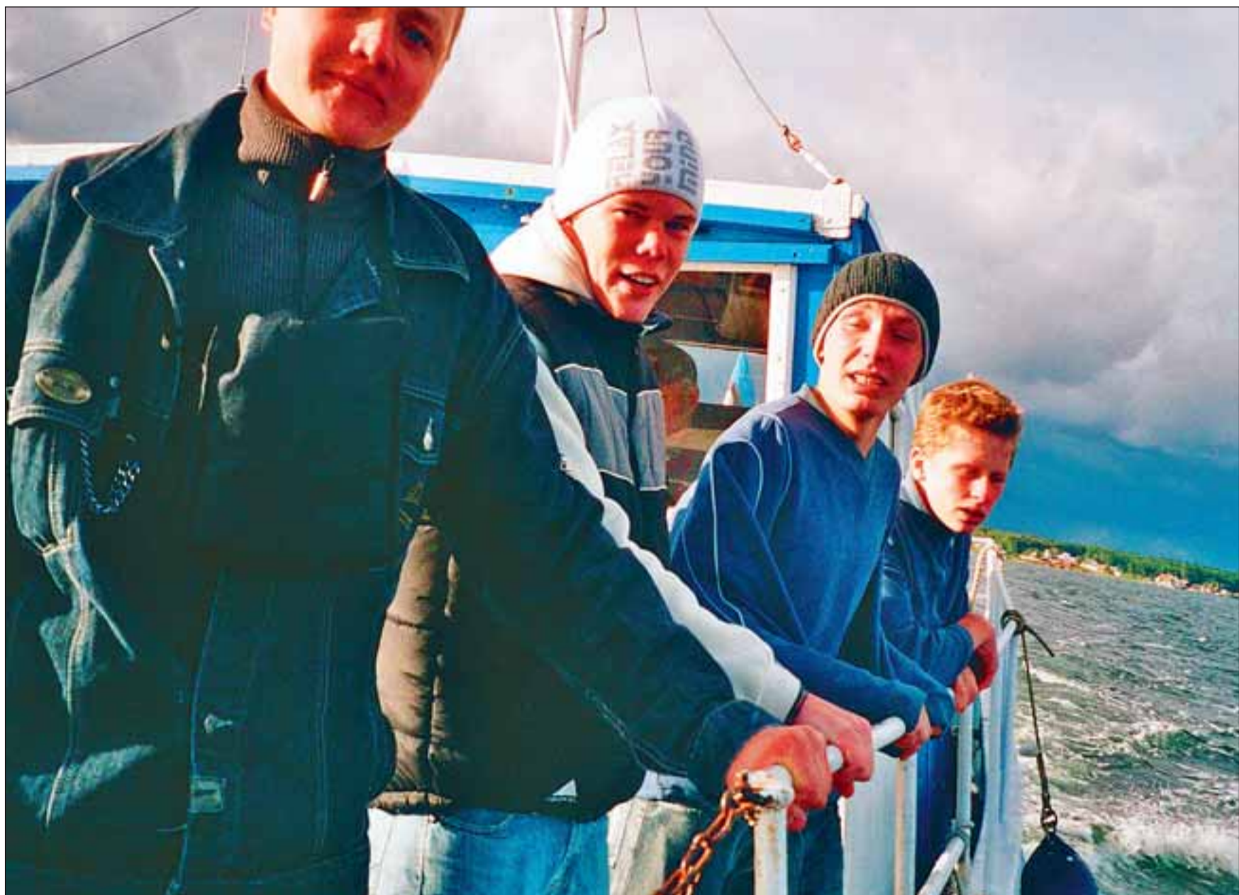
Juba teel Pranglile said noorkotkad tunda, mida tähendab tormine meri.