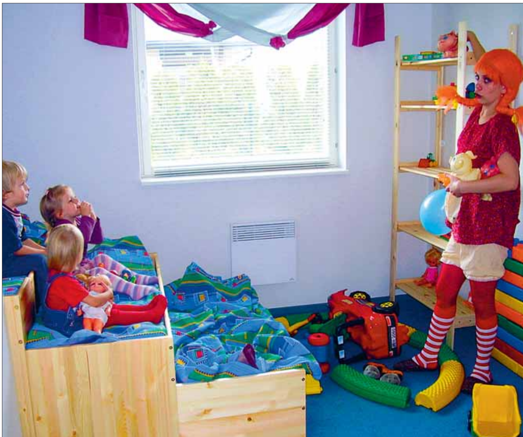
Avamispäeval osales ka kõigi laste sõber Pipi Piksukk.

Lastehoiid asub looduskaunis kohas, kus käeulatuses mets ja kelgumäed. Õuelõbude nautimiseks peab vaid ukse lahti tegema ning aiaga piiratud muruplats ootab väikesi tegutsijaid. (VT)