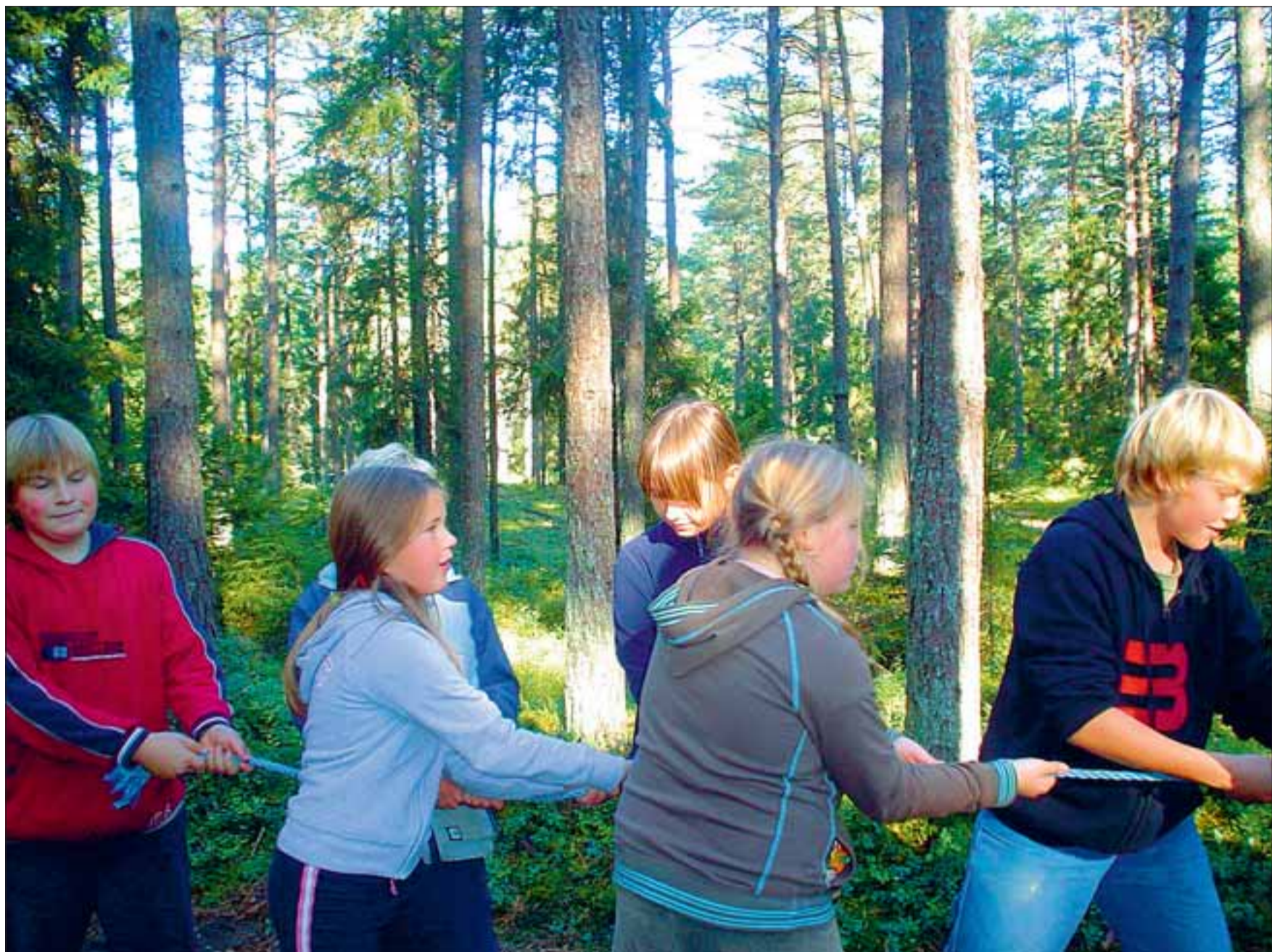
Seikluspäeva üks jõukatsumisi oli ka köievedu.