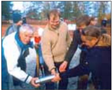
Püünsi kooli juurde rajatav korvpalliväljak sai 15. oktoobril pidulikult nurgakivi.