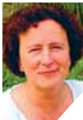
Kai Maran Peatoimetaja