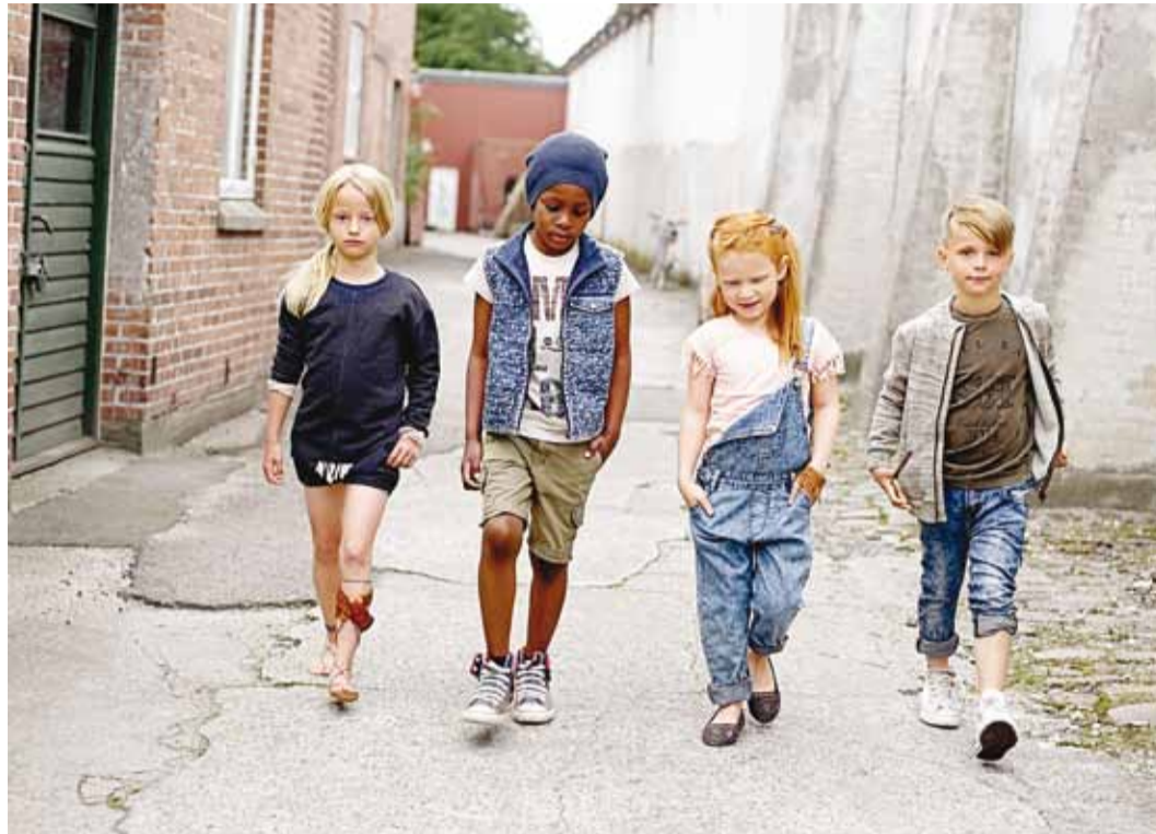
Mugav riietus eelkõige.