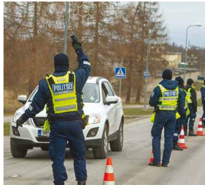
Politsei on ka sel aastal jaanipäeva aegu väljas suuremate jõududega.

Vaatamata sellele, et politsei kontrollib igal aastal juhte üha rohkem, ei näita olukord teedel olulisi paranemise märke. Kõik me võiksime sügavalt enda sisse vaadata ja küsida, kas mina olen teinud kõik selleks, et minu sõber, tuttav, sugulane, lähedane või naabrimees ei satuks rooli joo-kes seisundis ega täiendaks seda kurba statistikat. Kas oleme valmis võtma vastutuse, selle asemel, et peita jaanalinnu kombel pea lii-