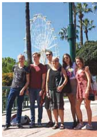
Pildil osalenud koos juhendajaga. Pildistaja jäi välja.

Noortevahetuse eesmärk oli keskkonnasõbraliku eluviisi edendamine. Üheksa päeva jooksul leiti viise, kuidas olla igapäevasel keskkonnasõbralikumad, ja arendati riikidevahelist arutelu, milline on toimiv olu-