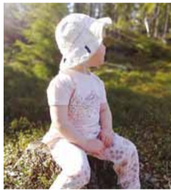
Moes on pastelsed toonid.

“Seetõttu peaks kindlasti eelistama pehmet puuvillast kangast rõivaid, mis lasevad nahal hingata ning lapsel mõnusalt liikuda.”