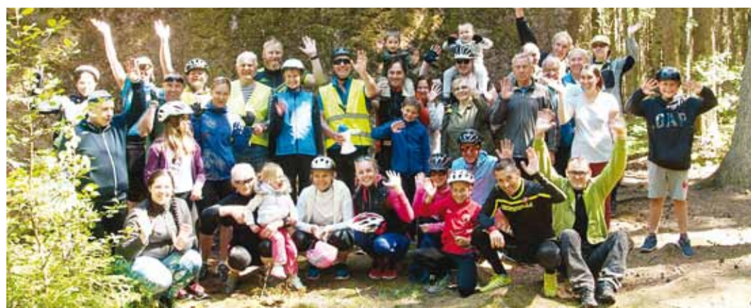
... ja nii see lõppes.