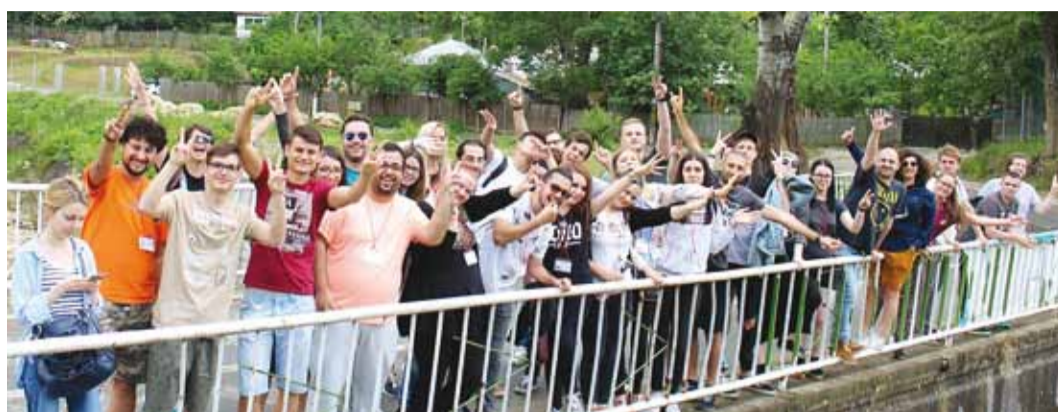
Grupifotol poseerivad Rumeenia noorsoovahetuses osalenud noored.

Projekt sai endale nime "Blue whale", mis tähendab inglise keeles sinivaala, ohtliku sotsiaalmeedia mängu järgi. Mäng koosneb väljakutsetest 50 päeva jooksul ning viimane nendest oli mängija enesetapp. Selliste juhtumite tõttu ning selle mõju tõttu noortele peaks küberkiusamisest palju rohkem rääkima. Selleks, et küberkiusamist paremini käsitleda, toimusid arutelud, tutvustati juhtu-