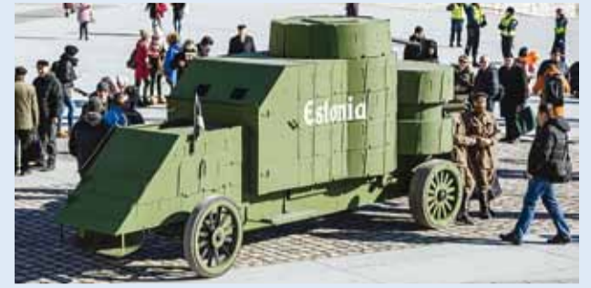
Märtsis näidati soomusauto "Estonia" koopiat Tallinnas Vabaduse väljakul.