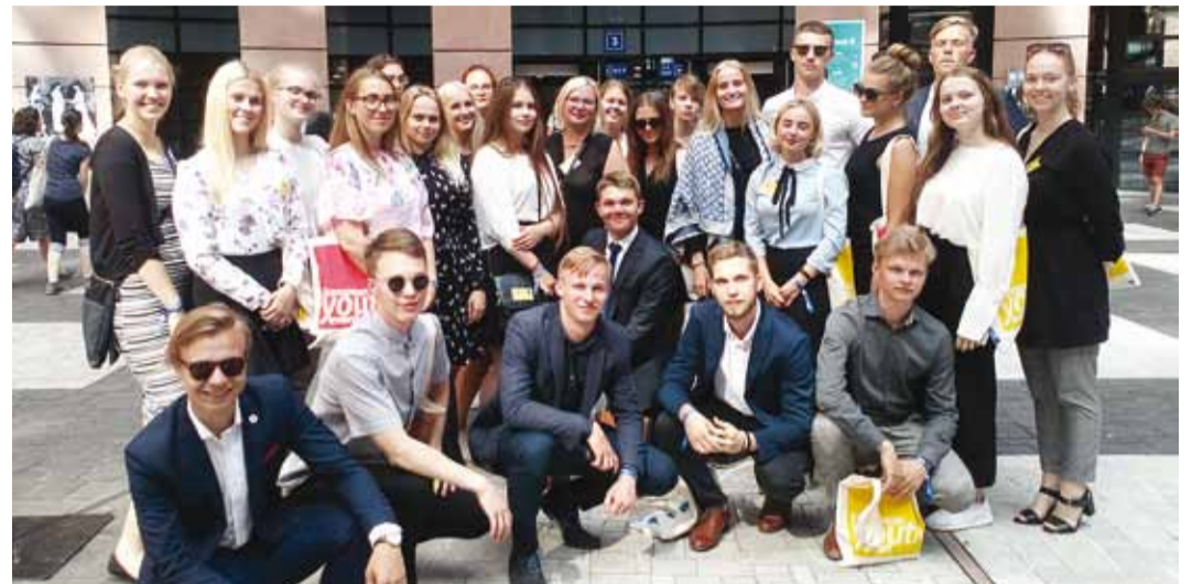
24 Viimsi Kooli õpilast koos saatjatega Strasbourgis.

Videos näeb kaheks jagatud ekraani: marssivaid üheteistkümnendikke ja tekstiga suhestuvaid looduspilte. Emily märgib, et väljakutseks osutus saada kõik õpilased ühel sammul marssima. Peale selle pidi ta looma tekstiga kokkuminevaid looduskaadmeid, mis annaks noorte sõnumi selgelt edasi. Videos kõ-