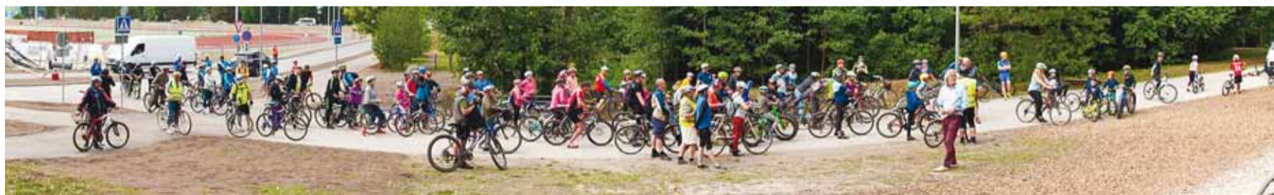
Kogu ratturite rivi pildile ei mahunud.