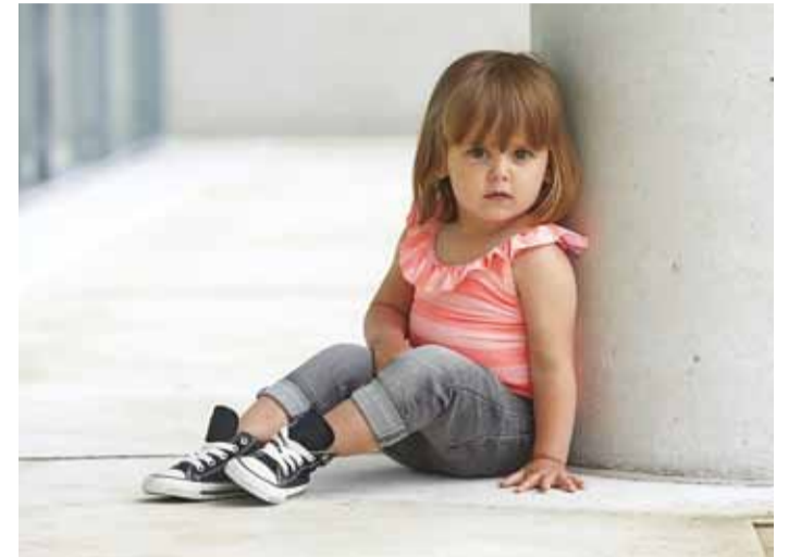
Ka triibuline on moes.

Populaarsemate toodete hulgas on hetkel ka ujumisriided