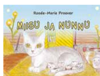
"Miisu ja Nunnu" esikaas.