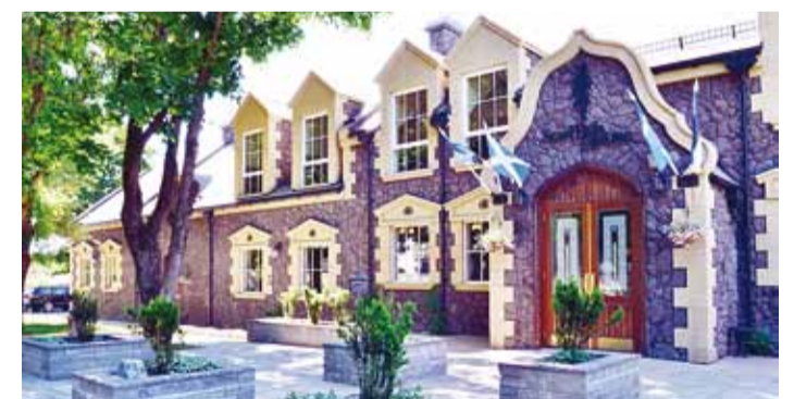
Parim ühiskondlik hoone – Keilas asuv Scottish House.

tegoorias tunnustati Keila linnas asuvat ajaveetmiskohta Scottish House. Kiriku kõrval asuvas vaikses tänavas olev pilkupüüdev šotipärane hoone tekitab esmapilgul vastakaid tundeid. Niivõrd erilisena mõju- des võib hetkeks uskudagi, et põlispuude varjust välja astudes näed silmapiiril Šoti mägismaa nõmmesid. Nimele vääriliselt on taotluslikult seda stiili aetud lõpuni, olles julgustavaks eeskujuks nii mõnelegi tagasihoidlikuma loomuga ettevõt- jale. Nimetatud kõrghaljastus ning kõrvalkrundile rajatud laste mänguplats teevad selle sobi- likuks vaba aja veetmise pai-