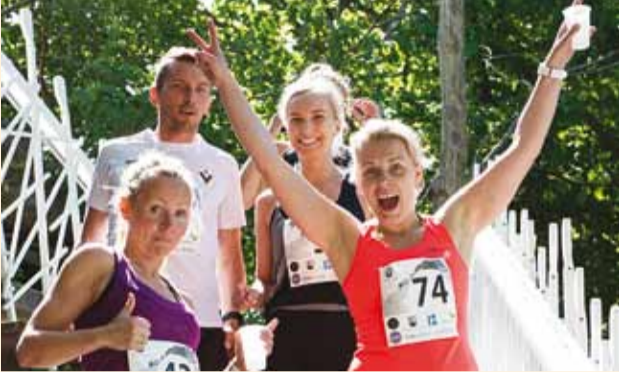
Trepjooks on parim!

Kiire tee viimsilaste südamesse leidnud Põhjakonna trepp on meie valla uhke rajatis. Mida aeg edasi, seda tuntumaks saab trepp ka seal aset leidvate võistluste tõttu.