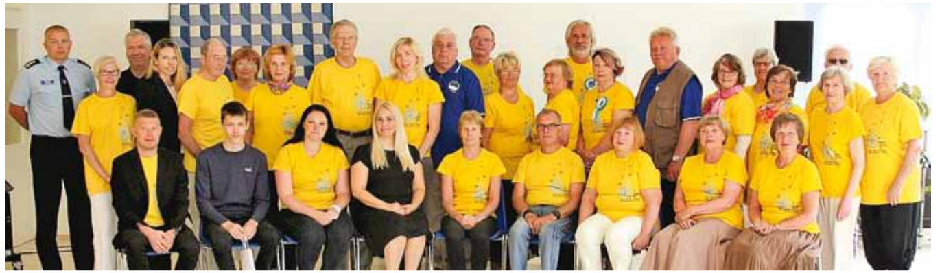
Harjumaa laulu- ja tantsupeo õnnestumisele kaasa aidanud Viimsi vabatahtlikud valla tänuüritusel.

Jälgi Viimsi valla uudiseid ja teateid ka kodulehelt www.viimsivald.ee ja sotsiaalmeediast www.facebook.com/ViimsiVald