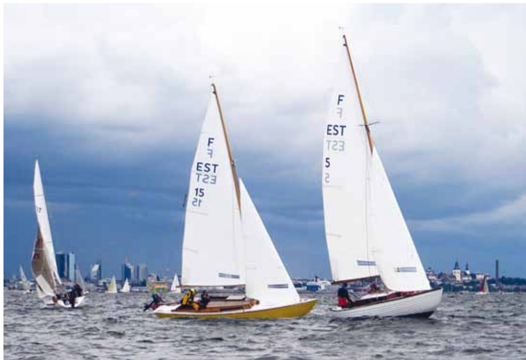
Folkboodid Tallinna lähel. Erkkollane on folkboot Tiina.

Tänavu selgitatakse välja ka Soome lahe parim folkboot kahe suure osavõistluse tulemu-