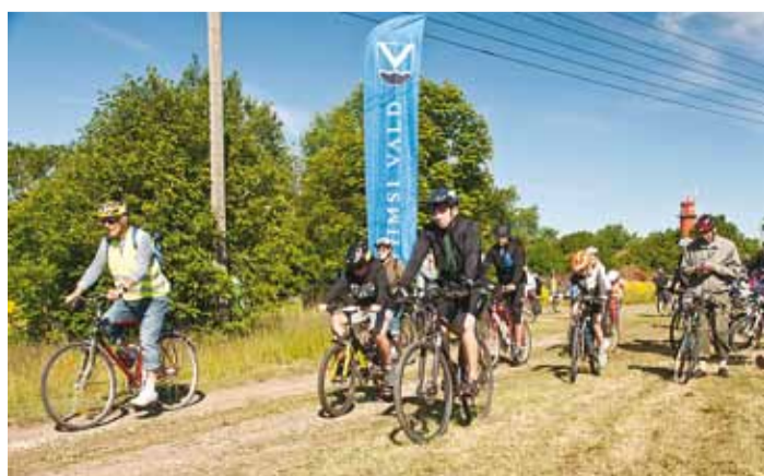
Nii see rattamatk algas...