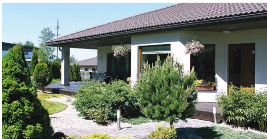
Kolmanda koha vääriliseks hinnati maja Haabneeme alevikus.

Komisjon hindas objekte kolmes kategoorias: eramud ja korterelamud tiheasustusalal, maakodud ning ühiskondlikud hooned või ettevõtted. Tavapäraselt oli tihedaim konkurents eramute kategoorias, kus hinnati terviklikku üldmuljet, kodu välisilme ja keskkonnaga kokku sobivat haljastust, omanäolisust ning headust. Traditsiooniliselt pälvivad erinevate kategooriate parimad Eesti Vabariigi presidendi tunnustuse. Maakondliku konkursi parimaid tunnustab Harjumaa Omavalitsuste Liit sätisel toimival tänuõnnitustel.