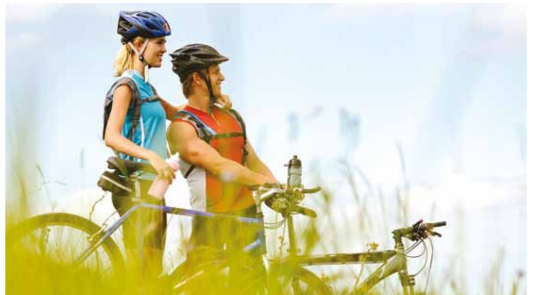
Jalgratturikiivri kandmine võib päästa elu ja hoida ära raskemad vigastused.

Kui ratas on korras ja turvavarustus olemas, siis tasuks meele pidada, et sõiduteed peab jalgrattur ületama selleks ettenähtud kohas (ülekaigurajal) takistamata jalakäijate liiklemist.