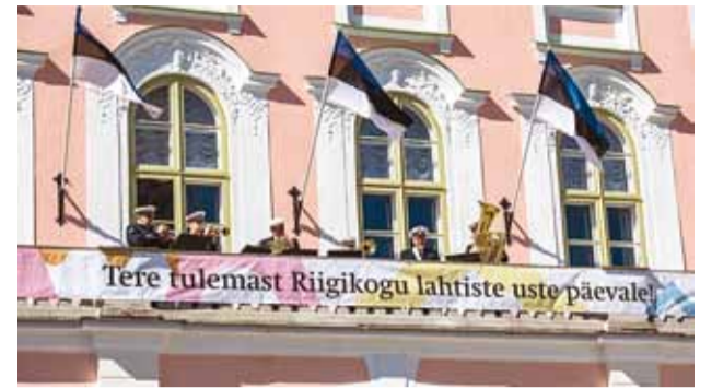
Riigikogu ukсед tehakse lahti ja rõdul toimub kontsert.