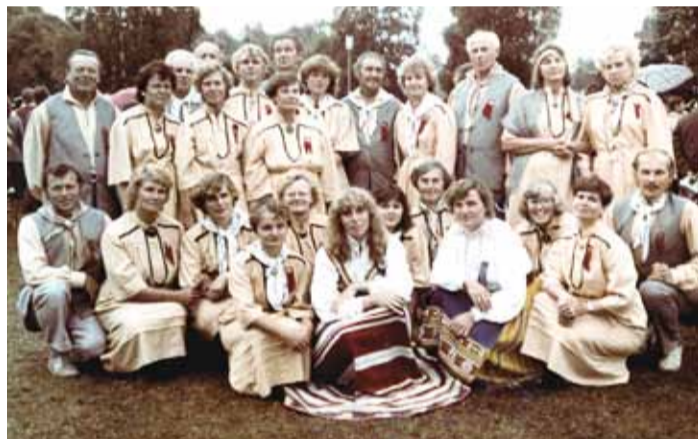
Segakoor Viimsi oma tegevuse algusaastail.

ditsionaal “Kumbaya”. Neid laule oleme kõige enam esitanud – küll meie sõprade juures Jyväskylä või esinedes kruisilaeval Baltic Queen, Veliki Novgorodis ja Varssavis, Taagepera lossis, Kadriinas, Tõrva kirik-kontserdisaalis, Sindis ja mujal.