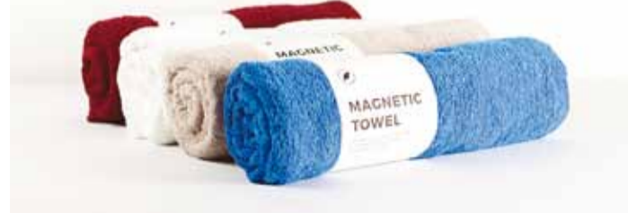
Magnetilised rätikud. Foto Magnetic Towel

Õpilasfirma asutasid noored 2016. aasta sügisel ning alates sellest on nad hoogsalt tegelema brändi loomise, tootedisaini arendamise ja ideaalse toote loomisega. Noored on Viimsi Kooli ja Pirita Majandusgümnaasiumi õpilased ning on võtnud eesmärgiks tuua turule midagi uutset ja huvitavat, kuid samas lahendada igavene saunalina probleem.