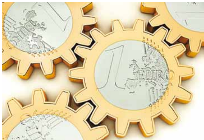
Programmi eesmärk on edendada väikesaarte kogukondadele osutatavaid teenuseid.

“Meie eesmärk on, et kõikidel Eesti inimestel, olenemata elukohast, oleks kvaliteetne elukeskkond. Eriti oluline on, et ennekõike oleks elanikele kättesaadavad just esmatähtsad teenused,” ütles riigihalduse minister Mihhail Korb. “Peame märkama ka väiksemaid kogukondi ja seetõttu oleme õla al-