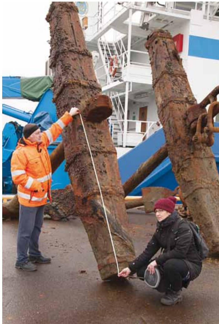
Hetk 150-aastaste ankrute mõõtmisel.

“Suured, üle kahemeetrise puidust tokkidega admiraliteed- diankrud leiti laevade ankurdamis- alast F. Meresõiduohutuse seisukohalt osutusid need veetalusteks takistusteks, mis võivad seada ohtu laevade ankurdamise samal merealal. Seetõttu otsustasime need sealt välja tuua. Mereväe tuukrid ja veeteede ameti laeva EVA-316 meeskond tõstis leiud novembris veest välja ja viisid need Hundipea sadamasse,” rääkis eelmise aasta lõpul veeteede ame-