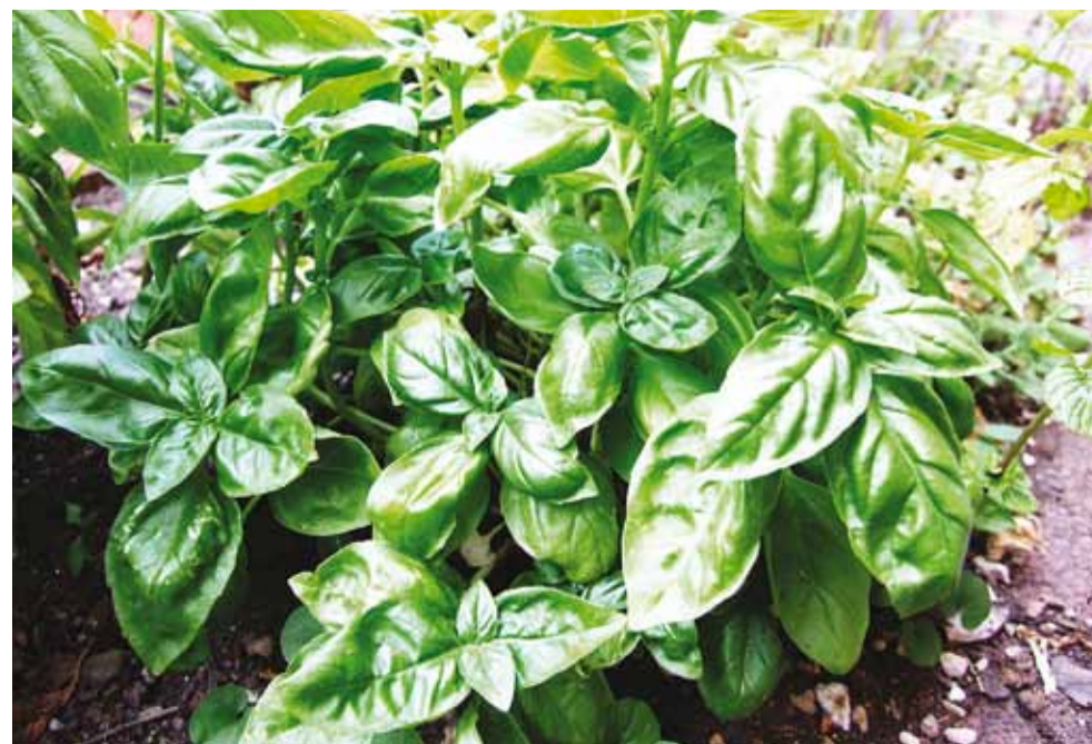
Basiilik on üheaastane taim, millel on väga palju liike ja sorte.