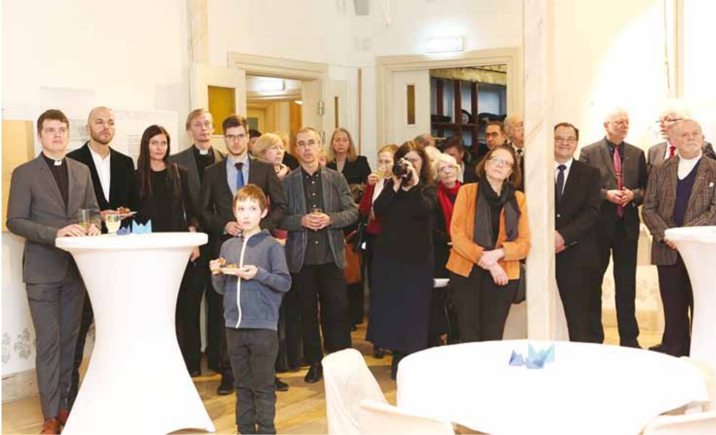
Mälestusüritusel osalejad Rannarahva muuseumis.