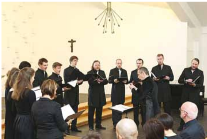
Vox Clamantisel on olnud edukas aasta – äsja pälvisid nad riikliku kultuuripremia XX hooaja ja albumi "Arvo Pärt. The Deer's Cry" eest.