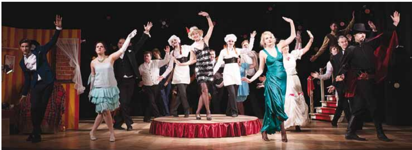
Viimsi Muusikaliteatri värvikas etteaste muusikalis "Drowsy Chaperone".