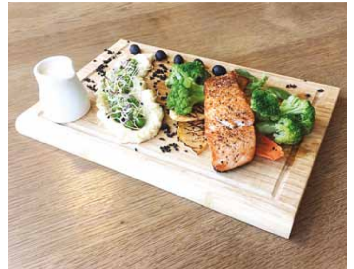
Oluline on värskus – kõik toidud valmistatakse värskest toorainest, need on kerged ja tervislikud.

Milliseid toite sulle eelkõige valmistada meeldib?