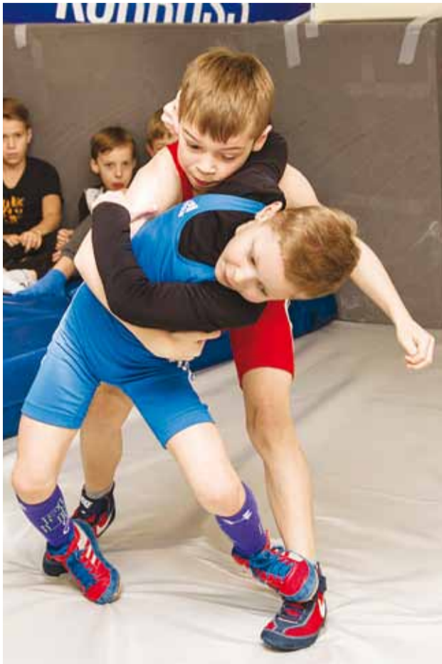
Tulevased maadlusässad Kelvingi uues maadlustoas.