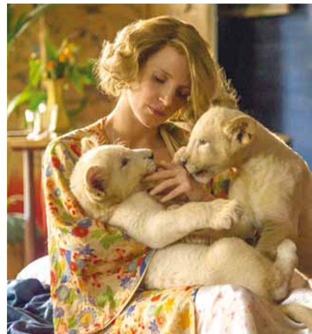
Jessica Chastain filmis "Loomaaedniku naine".

Juba nädalavahetusel tuleb ekraanile "Loomaaedniku naine". Teine maailmasõda oli tulvil lugusid inimeste vaprustest, üleelamistest ja kohati uskumatutest kangelaistegudest.