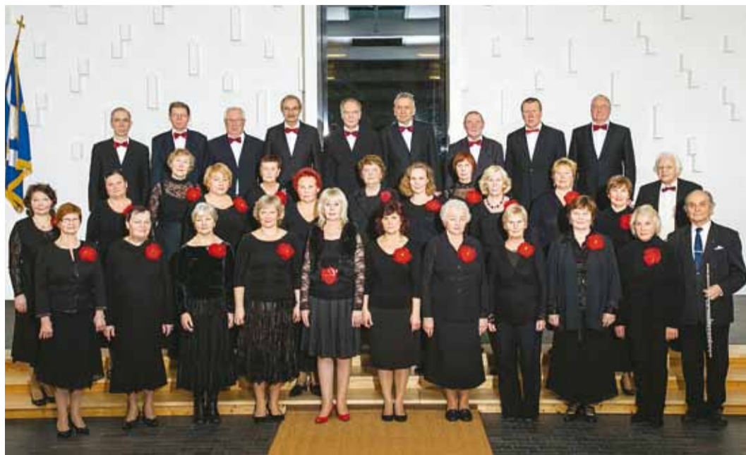
Segakoor Viimsi.

Meie lemmikuteks on L. van Beethoveni “Menuett”, J. Tätte “Tuulevaiksel ööl”, H. Woodsi “Olla koos”, H. Nybergi “Ave Maria”, U. Sisaski “Auväärne haldaja”, W. Boysi “Halleluja”, J. Kanderi “New York”, A. L. Webberi “Memory”, O. Fisheri “Kui ma oleksin kelluke”, aga ka P. Ripsi “Agnus Dei”, R. Rannapi “Rahu”, samuti laias ilmas klassikaks saanud R. Rodgersi “On sündinud laul” ja tra-