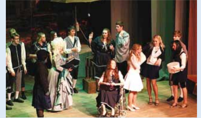
Hetk muusikali lavastusest.

Viimsi Huvikeskuses etendub 16. veebruaril koguperemuusikal "Nõiutud", mis on lavastatud Broadway lavaloomingu eeskujul põnevuse ja fantaasiasäraga.