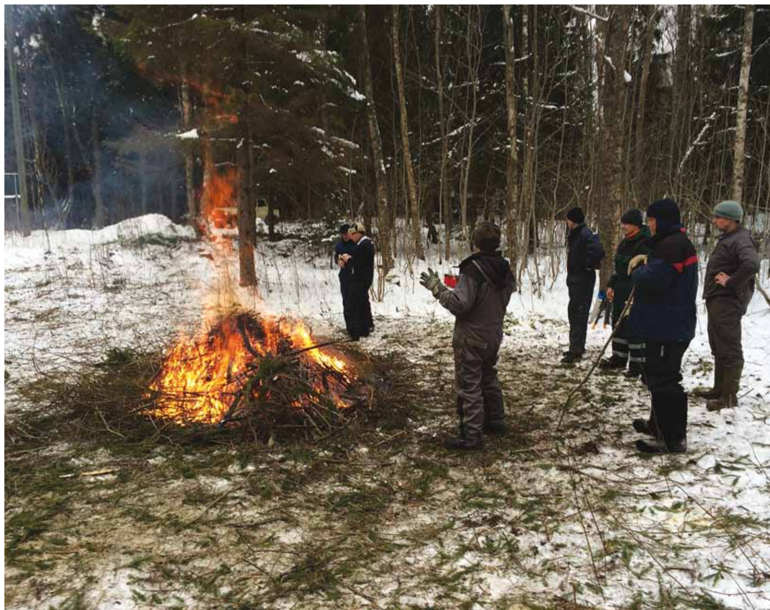
Talgulised on oma töö teinud.

Vaata mälestussamba asukohta ja ürituse parkimiskorraldust lk 3.