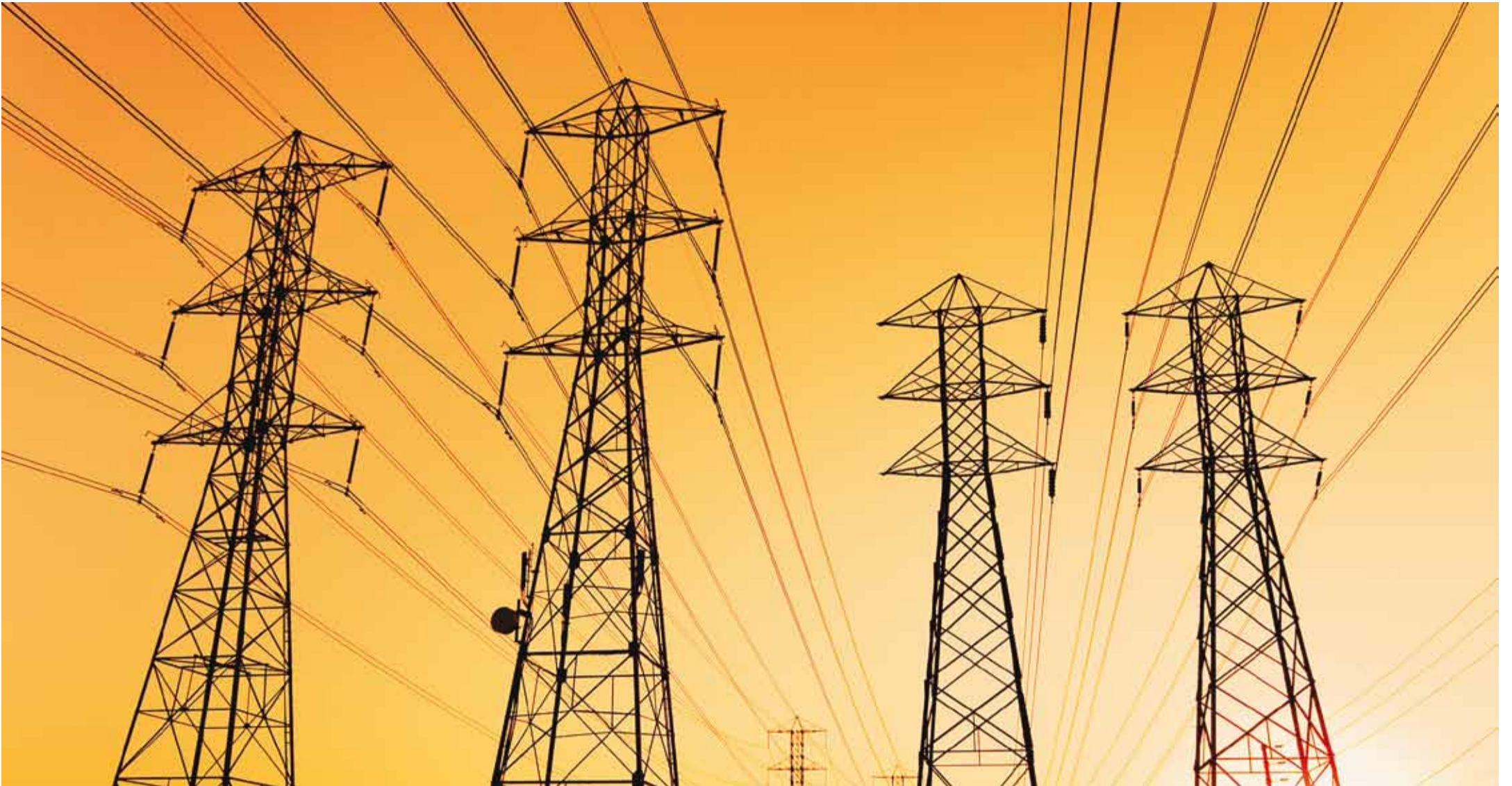
Elektrita ei kujuta me elu ette, aga tõenäoliselt ei kujuta me ette ka kõiki ohte, mis sellega seotud.