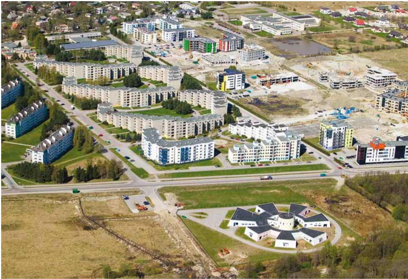
Haabneemes algas suur elamuarendus juba kalurikolhoosi ajal.

Nagu teada, koosneb valla eelarve põhiosas üksikisiku tulumaksust ehk sellest, kui palju on meie vallas tööealisi maksumaksjaid. Täna Viimsi elanikkond on Eesti keskmisest noorem ja lapsi iga tööealise kohta rohkem. Laste suur osakaal tähendab ühest küljest helget tulevikku, aga teisest küljest seda, et täna