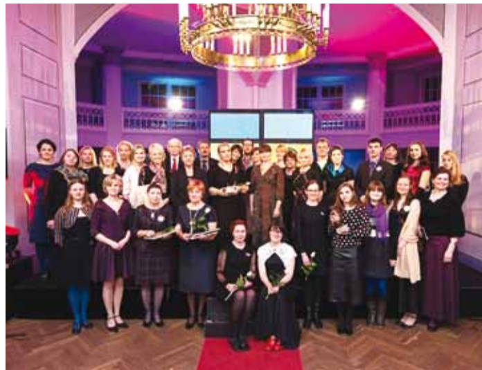
Eesti muuseumide esindajad auhinnapeol.

Ühelt poolt on konkursi eesmärk tunnustada parimaid muuseumispetsialiste, teiselt poolt tuua avalikkuse jaoks rohkem esile muuseumitöö erinevaid tahke. Soovitakse rõhutada, kui paljudes valdkondades tuleb ühel kaasaegsel muuseumil tegus ja tubli olla. Selle konkursi jaoks ei ole liiga suuri ega liiga väikesi muuseume, on vaid head või halvad ideed, professionaalselt teostatud või hooletult kokkuklopsitud projektid. Konkursil