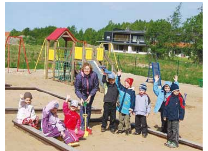
Lastevanemad kiidavad eralasteaadade paindlikkust ning lapsesõbralikkust.

Viimsi vallaga lepingusuhetes olevate eralasteaadade käivate laste vanemad kiidavad eralasteaadade paindlikkust ning lapsesõbralikkust keskkonda. Paljudele peredele on eralasteaad alternatiiviks munitsipaallasteaiale, kas siis lahendusena munitsipaallasteaia koha puudumisel või just selle kindla eralasteaia poolt pakutavate teenuste ning lisaväärtuste tarbimisel. Uue korraga on eralasteaia teenuse kasutamine lastevanematele tehtud veelgi paindlikumaks ja võimaluste- rohkemaks.