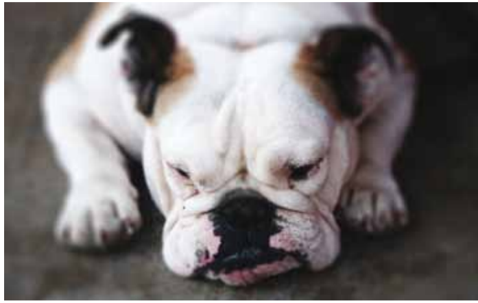
Meie vallas on koerte ja kasside kiibistamine ja registrisse kandmine kohustuslik.

Kuid oh häda! Viimati, kui ma mööda kooliteed jalutasin, tahtsin sõbrustada koolilastega, aga nemad, selle asemel, et minuga kaasa trallitada, hoopis kartsid hirmsasti ja väiksem hakkas isegi nutma. Pahandust sai sellest palju. Kutsuti välja mingid ametimehed, kes minu turja pealt midagi otsisid ja vist ka leidsid, sest kuulsin sõna „kiip“. Ja siis juhtuski kõige koledam