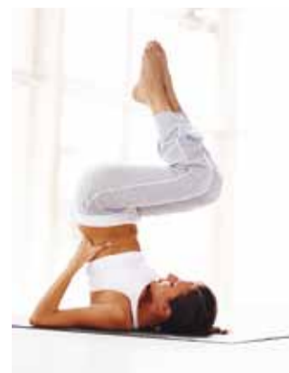
Vabastab ja tasakaalustab keha.

Idamaise tava kohaselt käsitleb shindo inimest kui tervikut, kus igal elundil ja energiakanalil on täita konkreetsed ülesanded. Igapäevaelu viib meid tasakaalust välja. Stress, depressioon, lihaskoormus ja emotsionaalsed pinged häirivad