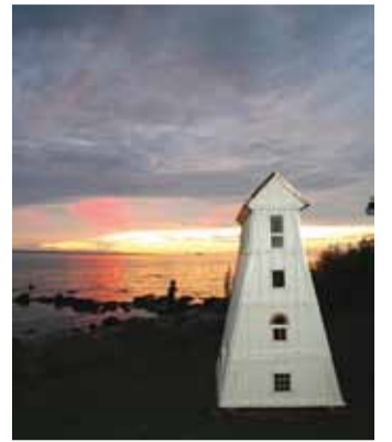
Andekate meeste kätetöö.