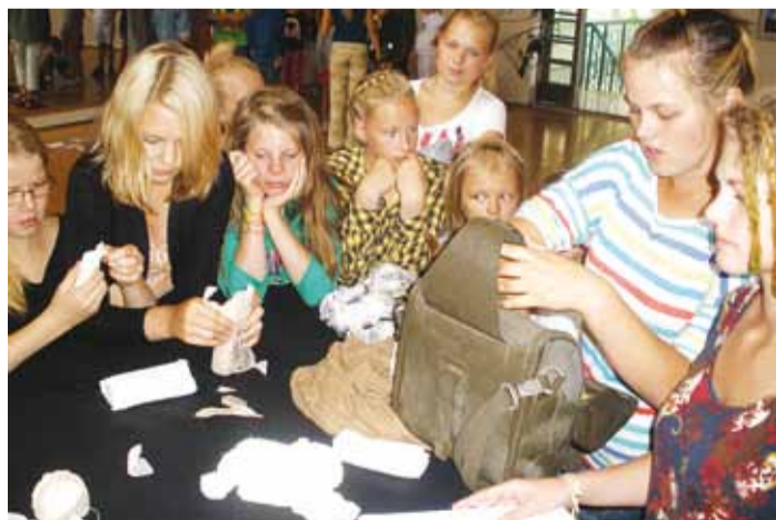
Kodutütred meditsiiniõppe tunnis.

Esimene päev kulus peasjalikult laagri püstitamisele ning töötubades nii mõnegi jaoks uute teadmiste ja oskuste omandamisele. Laagrilistele õpetati teemärkide tundmist, meditsiini, sõlmede tegemist, looduse tundmist ja topograafiat. Kuna selleaastane suve-