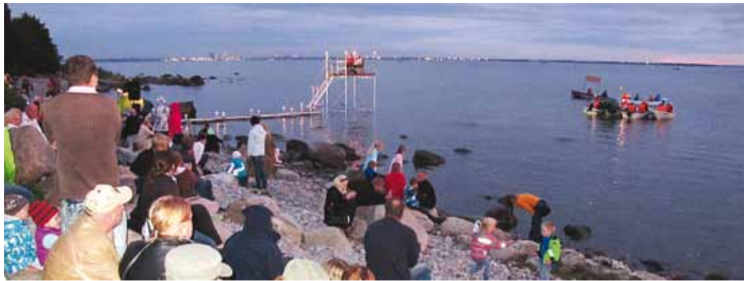
Mõned riimid sündisid kohapealset olustikku nähes.