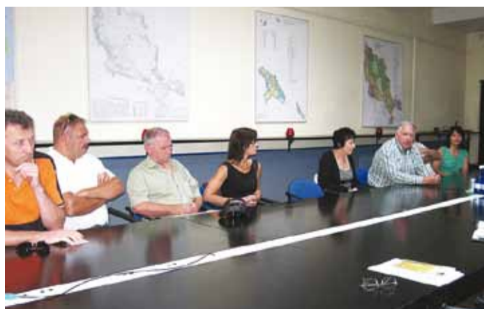
Poola koostööpartnerid vallamajas.

Mullu novembris sõlmiti Leedu kokkulepe, mille järgi Leedu, Poola, Slovakkia ja Eesti partnerid hakkavad ühiselt turismi alal koostööd tegema. Ühisprojekt on piiritletud iga osaleva maa muinasjututeema ja -tegelasega. Eesmärk on edendada ja arendada turismi, määratleda igal maal turismirada, tutvustada üksteise juures koostööpartnerite muinasjututegelasi, keda turismirajaga seostatakse, siduda turismirada kohalike toodetega ja tutvustada neid ning integreerida koostööpartnerite kogukondi. Koostööpartneritena nähakse nii maal asuvaid ettevõtjaid, turismiedendajaid ja üksikisikuid