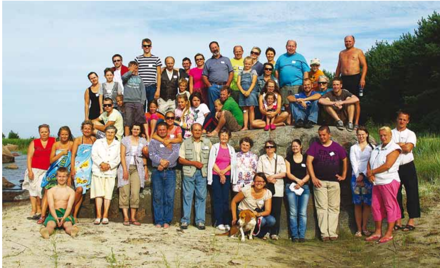
Raja suguvõsa Leppneeme rannas.

1930ndatel toimus Eestis nimede eestistamine, mille käigus sai endale uue perekonnanimi umbes 200 000 inimest.