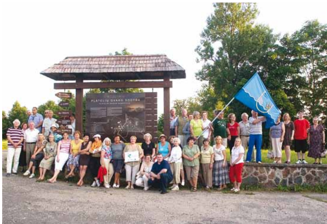
Projekti-, laulu- ja tantsuhuviline reisiseltskond Leedumaal.

Õppereis oli vastuseks eelmisel suvel toimunud leedukate samasugusele reisile Viimsi, Rae ja Jõelähtme valla Leaderi objektidele, seepärast oli ka meie reisi seltskond komplekteeritud nende valdade aktivistidest ja isetegevusrühmadest. Reisil olid Rae vallast meesansambel Kuldne õhtupäike, Randvere seniortantsurühm Kobarake ja naisansambel Kibuvitsalill, kes esinesid oma kavadega piirkondlikul isetegevusfestivalil Pilviski ai asulas Lõuna-Leedus. Meie isetegevuslaste esinemised võeti väga soojalt vastu. Festival langes kokku Leedu ainsa kuninga Mindaugase, kes oli võimul aastatel 1253–1263, kroonimispäevaga, mis toimus 6. juulil 1253. See päev on Leedus suure au sees ning seda tähistatakse igal aastal igas külas, alevis ja linnas keskusesse kogunemisega ning täpselt kell 21.00 rahvushümni laulmisega. Ka meil oli võimalik sellest tseremooniast ühel külaplatsil osa saada ja lisaks ka eesti laule tutvustada.