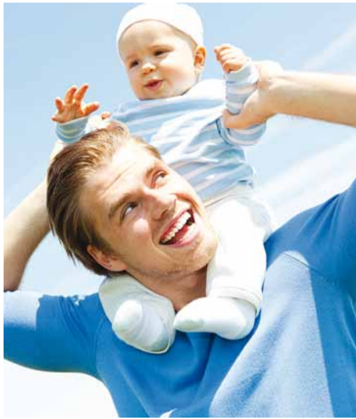
Kuidas olla lapsevanem, saab teada koolis.

Sel sügisel viib MTÜ Arengukeskus Avitus vanemahariduse programmi raames läbi lapsevanemate kooli Tallinnas, Keilas ja Viimsis. Avitus on asutatud 2006. aastal ning pakub mitmekülgseid ja üksteist toetavaid teenuseid-tegevusvõimalusi, mis aitavad kaasa inimese vaimsele, emotsionaalsele ja füüsilisele tervisele ning tasakaalule.