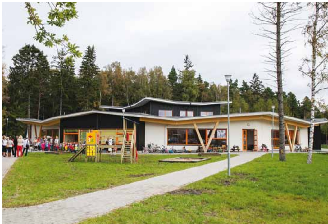
Laanelinnu lasteaed sobib hästi loodusega ning on kaunis nii seest kui väljast.