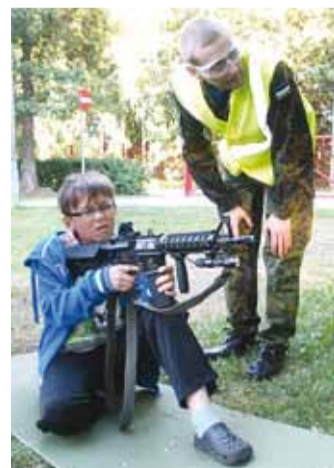
Harjutus airsoft relvaga.

Teine päev oli üles ehitatud sportmängudele. Omavahel võeti mõtu korv-, jalg- ja rahvastepallis ning teatevõist-