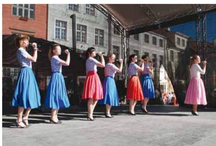
Esinemishetk Raekoja platsi laval.

Juuniku paiku ilmnas, et peame esitama algselt palutud (2 x 30-minutilise) programmi asemel hoopis ühekordse ning tervikliku koondprogrammi, mille kestvus kokku 45 minu-