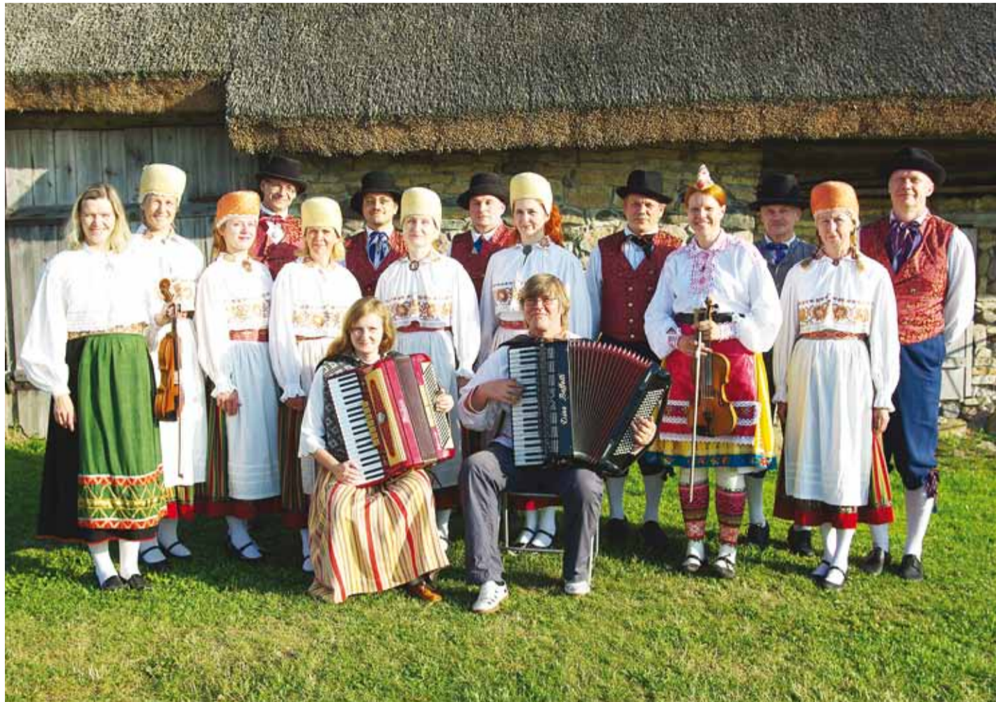
Vallaalune ja noortekapell Viimsi Vabaõhmuuseumis.

Suurimaks sündmuseks tuleb lugeda Soome-Eesti III tantsupidu. Kahjuks toimus see väga kehvapäeval enne jaanipäeva. Nii said endale peol osalemist lubada vaid neli paari. Kaks päeva ühisproove Tallinnas ja sama palju Tampere üllatavas ilusa ilmaga. Pidu ise