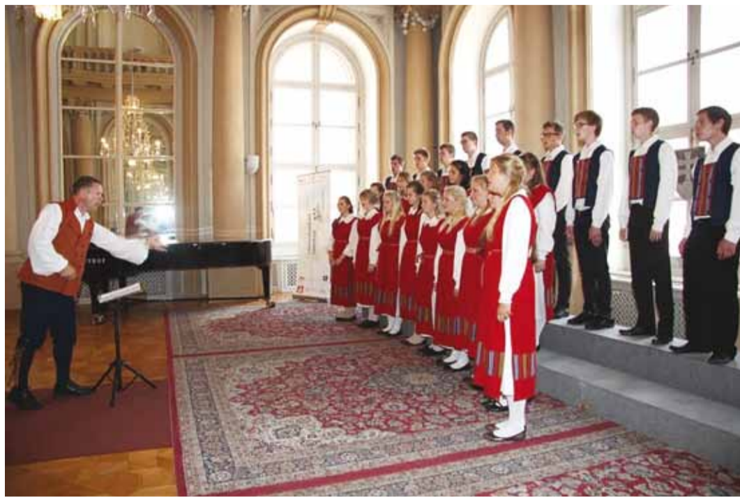
Viimsi Noortekoori esituses kõlasid Bratislavas eesti rahvalaulud.

Saime palju teada eesti muusikast ja heliloojatest. Kui