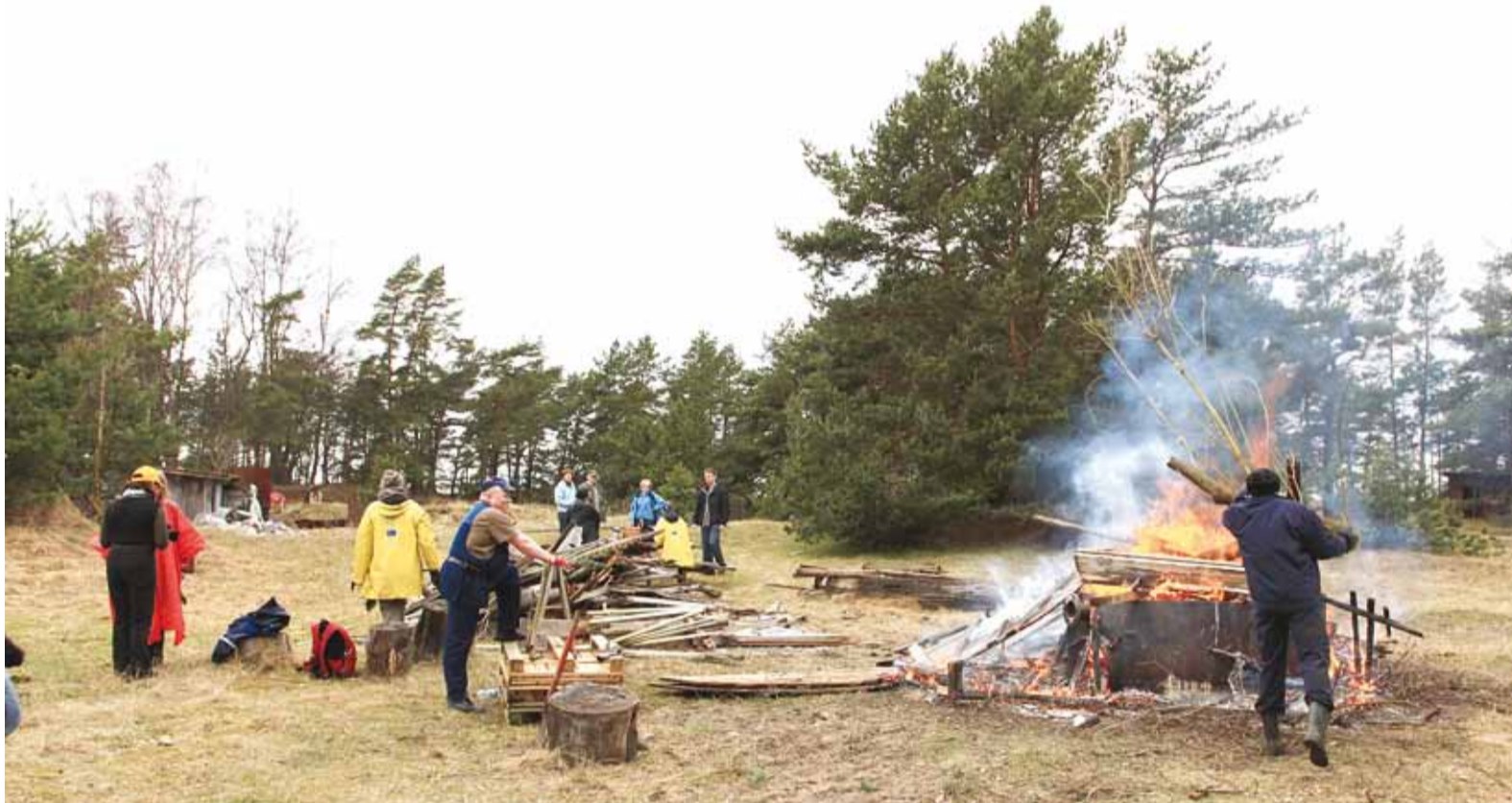
Talgutööd Naissaarel Tagakülas tuletorni ümbruses 1. mail 2010.