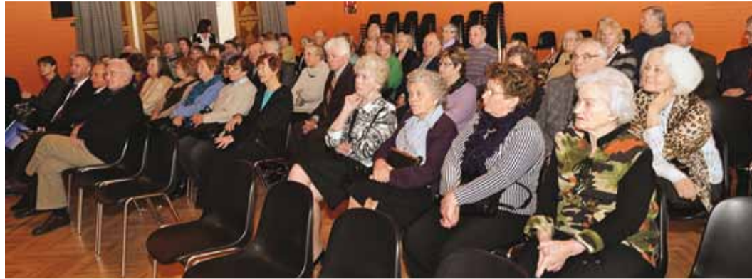
Viimsi Pensionäride Ühenduse aastakoosolekul oli osalejaid tublisti.

2011 oli valimiste aasta, kus valiti uus volikogu ja juhatus.