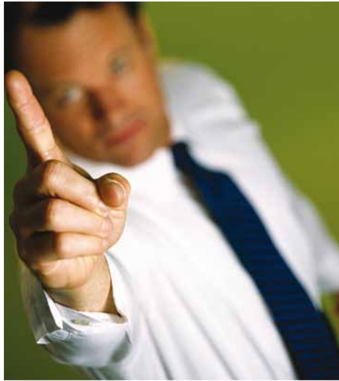
Tööandja ei tohi omaalgatuslikult lõpparvet kinni pidada või vähendada.

Töösuhe lõpeb ühepoolse tahteavaldusena sel kuupäeval, mis kirjas, tööandjal ei ole võimalik töötajat kinni hoida ning