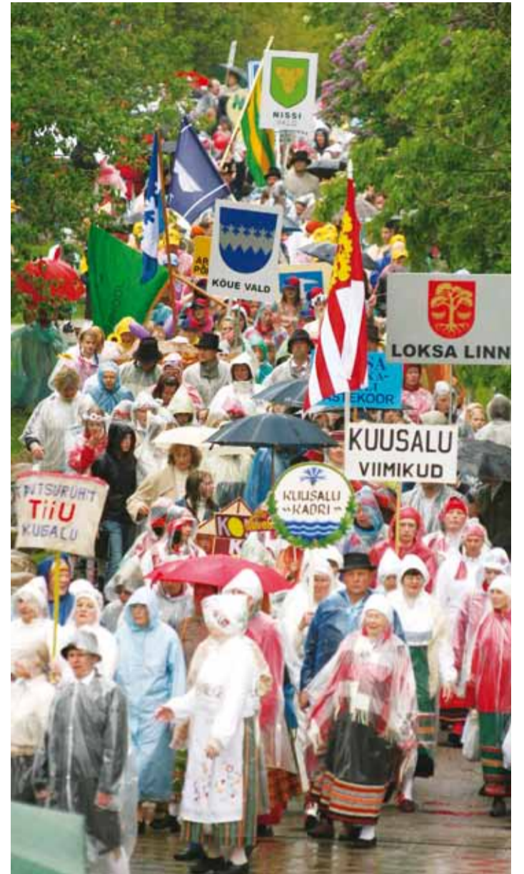
Tänu HOL-ile on maakonnas sündinud ja püsima jäänud Harju laulu- ja tantsupidu.