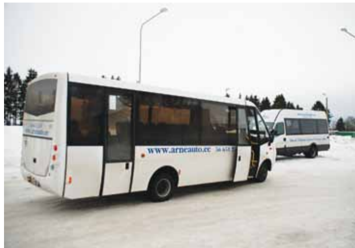
Kommertsliine on Harjumaal rohkem kui avalikke liine. Allar Viivik