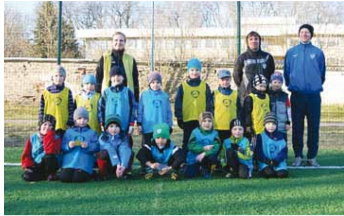
Pärast mängu tehti ühispilet ja jagati sokolaadimedaleid.

Siis aga oligi käes õhtu. Õnneks oli ilm väga ilus ja päikeseline, mis tõi staadionile päris palju toetajaid, nii lapsevanemaid kui ka sõpru lasteaiast. Kell 17.45 olid kõik noored mängumehed vutimurul ning algas soojendus ja harju-