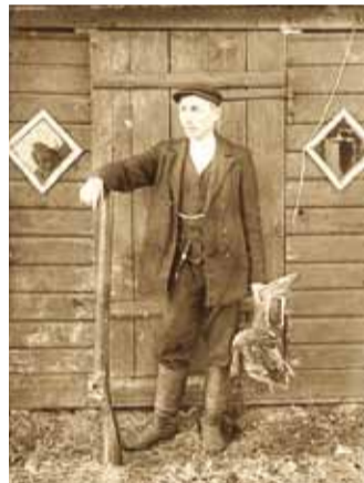
Linnukütt lastud linnuga, u 1910.

pehmet sulesängist tõustes küsis ta pererahvalt, mis imet neil küll selles voodis on. Vastati naljaga pooleks, et kirpa seal igatahes ei ole.