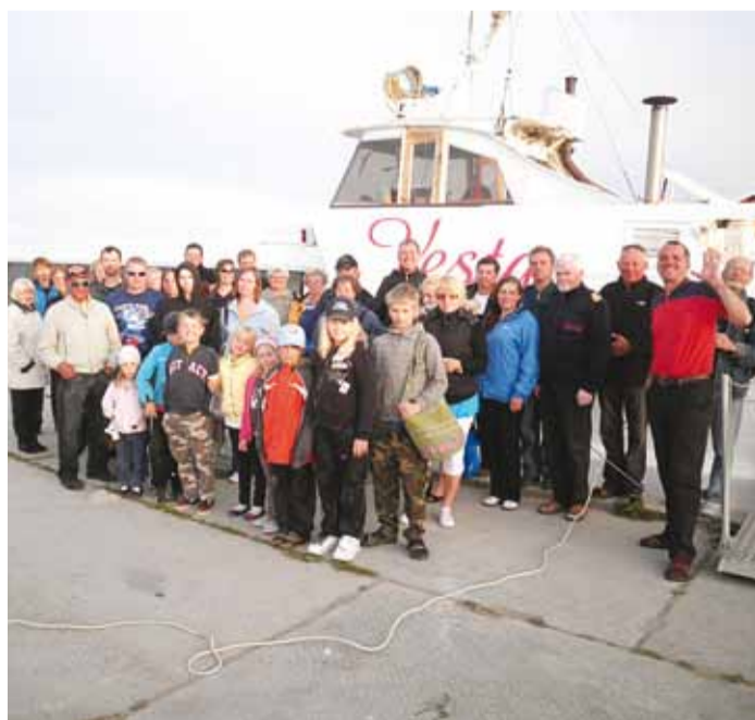
Prangliilased teel meremuuseumisse.

Mõeldud, tehtud! Kuna reisisikulused olid väga suured, kirjutasime palvekirju mitmele poole. Meile suureks positiivseks üllatuseks tuli ideega kaasa Kihnu Veeteed OÜ, kes maksis kinni poole meie reisisist Lennusadamasse. Poole kuludest maksis kinni Prangli Saarte Külaühing MTÜ, mis kokkuvõttes tähendas, et kogu sõit oli saareelanikele tasuta.