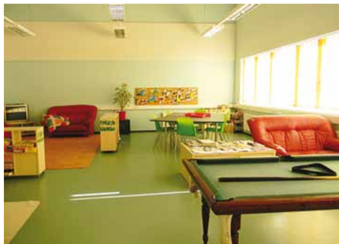
Randvere Noortekeskus.

Aastate jooksul oleme tei- nud palju töötube, kus noo- red saavad ise midagi vahvat meisterdada, erinevaid üritusi, võistlusi, projekte ning alates 2010. aastast saab Randvere Noortekeskuses õppida kitar- rimängu. Tegemist ei ole päris muusikakoolist saadava hari- dusega, kuid pillioskuse saab suure tahtmise korral selgeks küll.