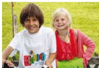
Laagris omandatakse keelt mängeldes.

Helen Doron Early English Viimsi Huvikool ootab 6–9-aastaseid lapsi inglise keele linnalaagritesse suvel kahel korral: 25.–29. juunil ja 13.–17. augustil.