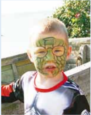
Näomaaling tõstab tuju.

On tähtis, et lapse sünnipäev kui aasta tähtsaim sündmus kujuneks eriliseks.