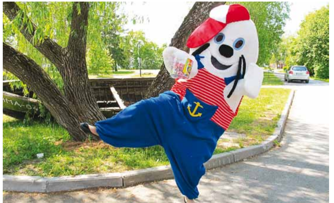
Lõbus Vigri-Migri on kindlasti kohal kõigil muuseumi suvesündmustel, nii jaanipäeval kui Rannarahva Festivalil juuli lõpus.

Vigri-Migri koristab vajadusel siin-seal mereranda ning kutsub lapsi mere äärde õhuvanena nautima ja liivalossi ehitama.