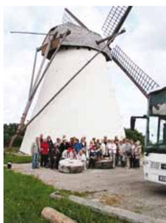
Reisirühma Seidlas.

Reis kulges mööda Piibe maanteed Aegviidu poole. Kui olime läbinud Aegviidu, Jäneda,