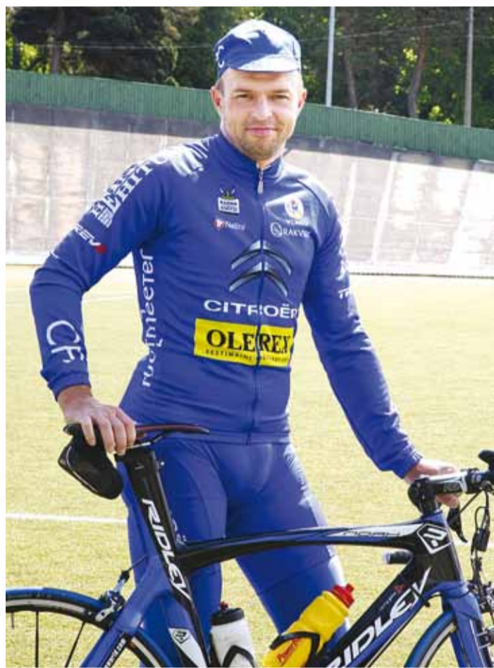
Jaan Kirsipuu kutsub osalema Tallinna Rattarallile.

Nii ralli start kui ka finiš on Pirita kloostri juures asuvas parklas. Rahvasõit algab kell 10 ja lõpeb selleks ajaks, kui rajale lähevad profid. Rattaralli rada kulgeb mööda Vananarva maanteed Iru elektrijaama juurde, sealt Loo alevikku