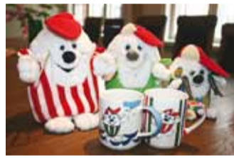
Vigri-Migri kruusist maitseb jook paremini.

Vigri-Migri õpetab, kuidas vanaemadele-vanaisadele mõnusat merevee-jalavanni teha.