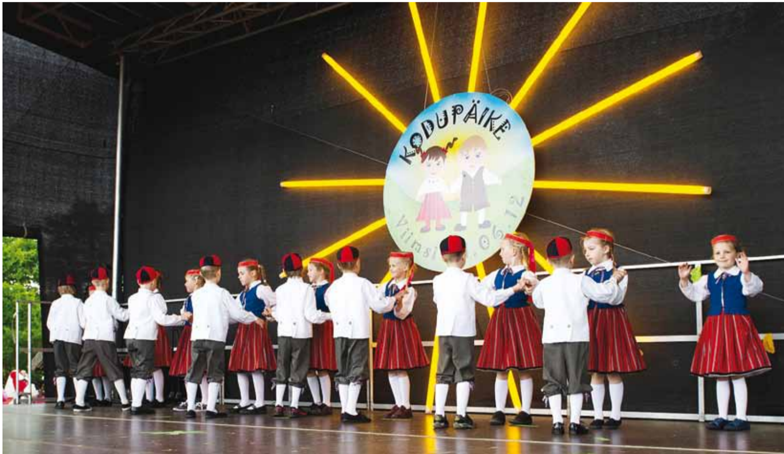
Tulevikuplaanides nähakse, et eelkooliealiste tantsupeost kasvab välja oma rahvatantsupeo traditsioon.