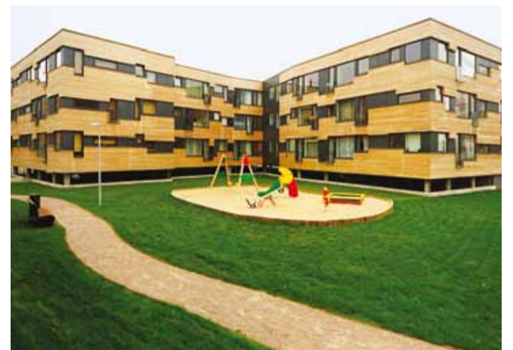
Tammeõuel on mõeldud ka turvalisele ühisruumile ja lastele.

Suuri kaeve-, lõhkumise- ja muud olulist müra ja tolmu tekitavaid töid ehitus ei eelda, seega loodavad ehitajad ümberkaudsete elanike igapäevast