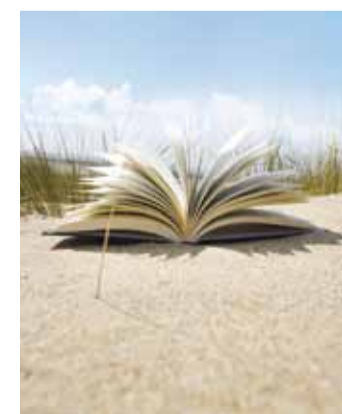
Läbiloetud raamatu kohta joonistab laps pildi.

Suvised võistlugegemisega kutsuge lapsi veetma suvel oma vaba aega raamatute seltsis. Võimalik on osaleda kolmes vanuserühmas, kus igale vanuserühmale on raamatukoguhoidjad välja valinud raamatud, mis tuleks läbi lugeda. Nimekirjast võib valida endale sobivas järjekorras lugemiseks sobiva raamatu, nimekiri on kättesaadav raamatukogu koduleheküljelt alates 25. juunist. Osalejad saavad raamatukogust endale lugemispassi, kus on