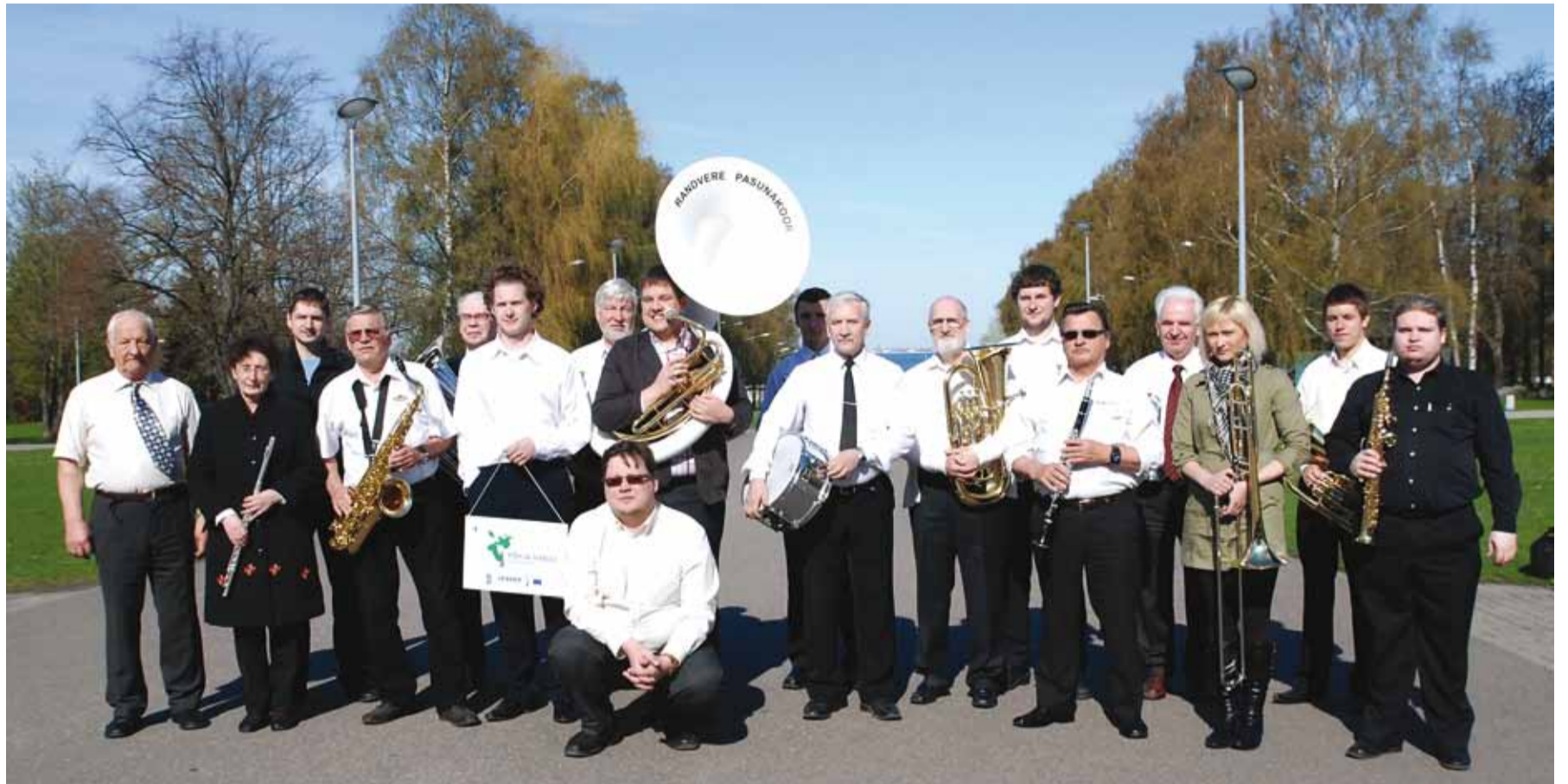
Randvere pasunakoor.