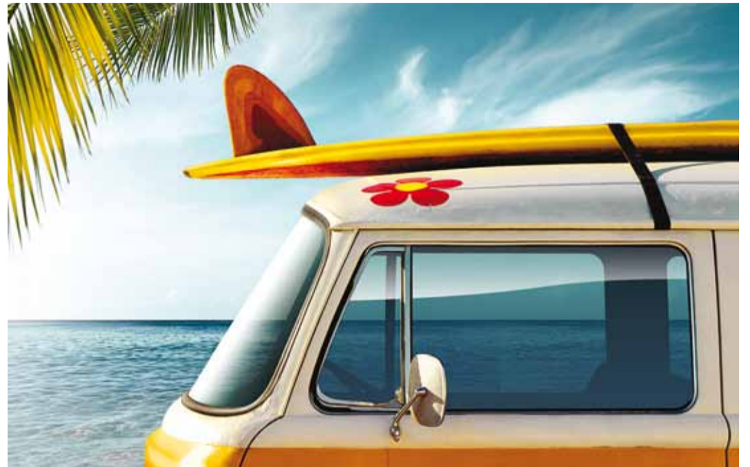
Reisikindlustuse leping või ravikindlustuskaart teeb reisi turvalisemaks.

Kindlustust ostes pööra tähelepanu kindlustussumma suurusele, mis peaks katma sinu