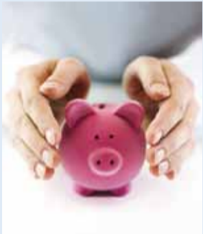
Kindlusta oma riskid.

Laenuga kodu ostes või liisinguga autot soetades pead kodu või auto ka kindlustama, sest selleks kohustab sind laenu- või liisinguleping. Tasub teada, et sa ei pea kindlustust sõlmima laenu või liisingu andnud panga või muu ettevõtte pakutavas kindlustusseltsis, vaid võid ise seltsi valida.