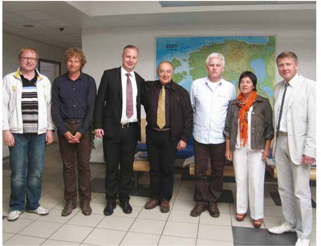
Contact-2103 juhatuse liikmed ja nende vastuvõtjad vallamajas.