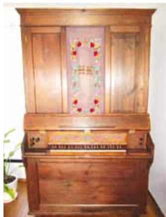
Uunikum – orel aastast 1894.

tegevus üleminekuks käsitsitööl arvutite potentsiaali ja võimaluste kasutamisele.