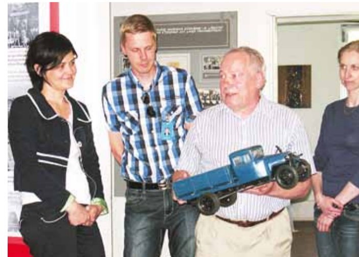
Lisandub veel üks oluline eksponaat.

1970ndatel filmitud kaadrid kolhoosist, selle tootmisüksustest ja inimestest – kõik kokku annab ka välismaalastest külastajale ülevaate omaaegsest suurtööstusest, omainimestele toob see meelde endisi aegu. Polnud siis ime, et kokkutulnud kümnekonnal endisel kirovlasel oli palju meenutada. "Poisid, kuulake!" alustas aegajalt Alaküla, kel jäi vähe mah-