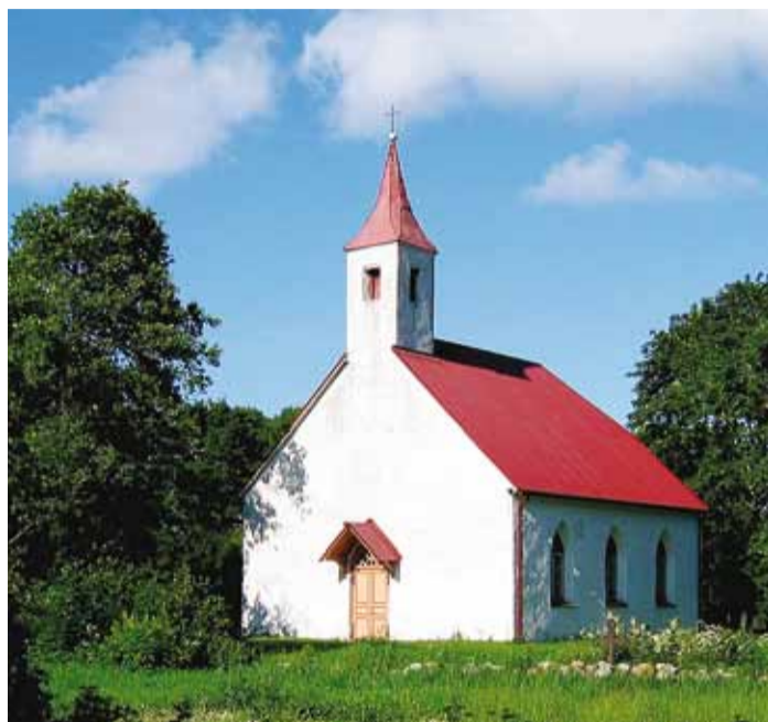
Peagi 160-aastane Randvere kirikuhoone.

Iseseisva koguduse ja kiriku ülalpidamine polnud algusest peale kerge, majanduslik toimetulek seati Jõelähtmest eraldamisel üheks põhitingimuseks. Iseseisvumise hetkel oli Randvere koguduses 250 hinge, samas loodeti selle arvu kahekordistumist, kui kogudusega oleks liitunud ka külades elavad linnakoguduste liikmed. Mõningane elavnemine toimus 1930ndate keskel, kui peamiselt ümbruskonna küla-