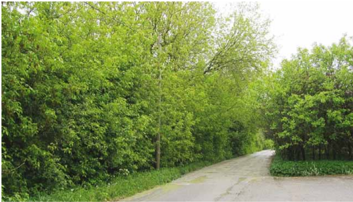
Lilleoru tee – teemaa on mõlemalt poolt võssa kasvanud, paiguti on oksad asfaldi kohal.

Lisaks võetakse võsa maha bussipeatuste ümber, haljakutelt, sadeveekraavidest jm kommunikatsioonide trassidelt. Igasugune jooksev info ja lisatööd kajastatakse jooksvalt valla kodulehel.