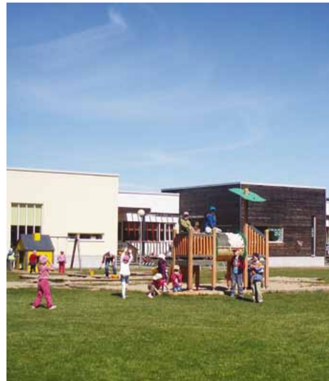
Lasteaia õu on avar.

Käesoleva aasta augustis täitub Randvere lasteaial viies tegutsemisaasta. Need aastad on olnud täis rõõmu ja tegutsemist, mõnikord ka ebaõnnestumisi. On ju see viimane loomulik kasvamisepos.