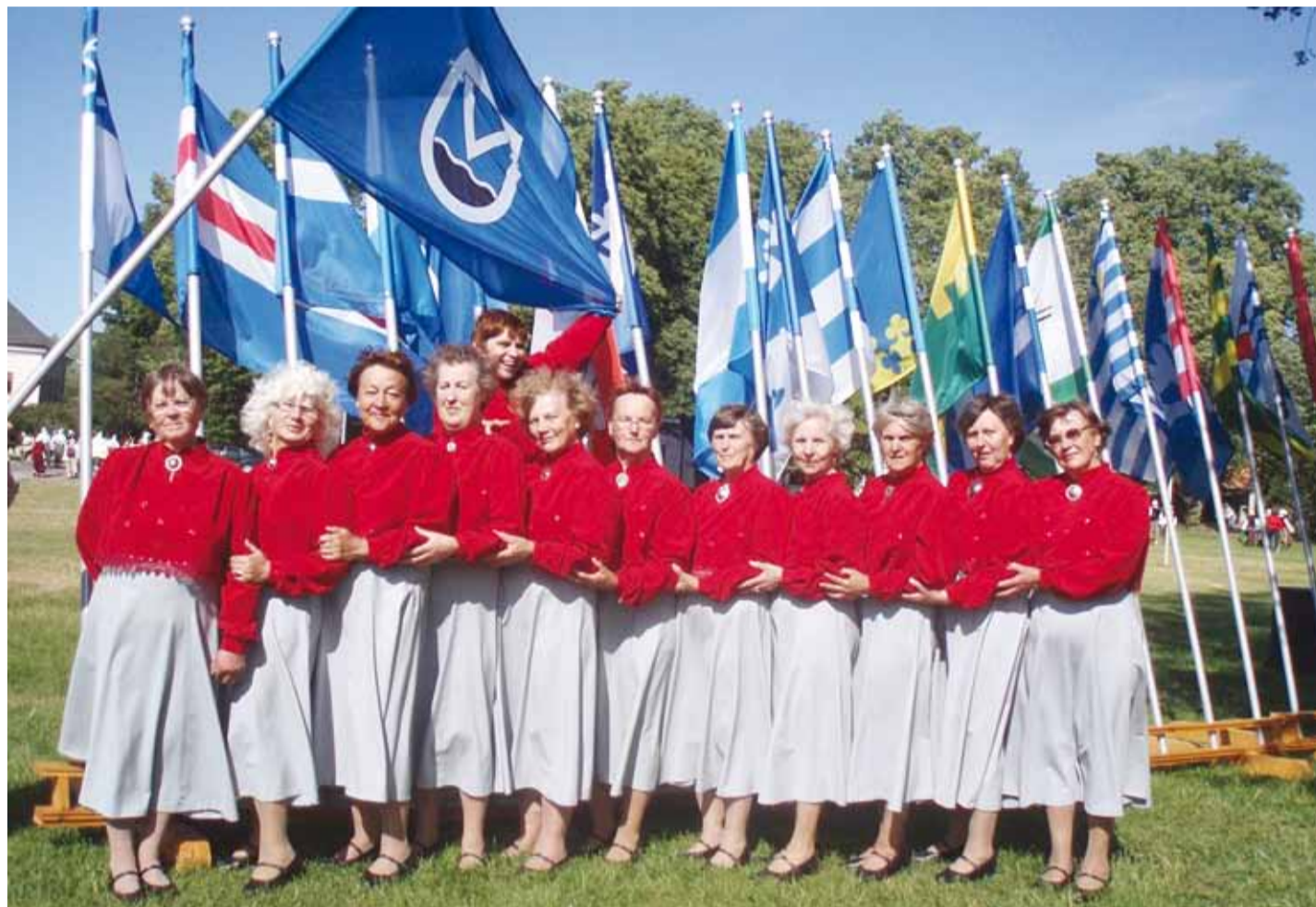
“Kobarake” esindamas Viimsi valda Harjumaa seenioride tantsupeol Loksal.

615 aastat Randvere küla esmamainimisest ajalooürikut