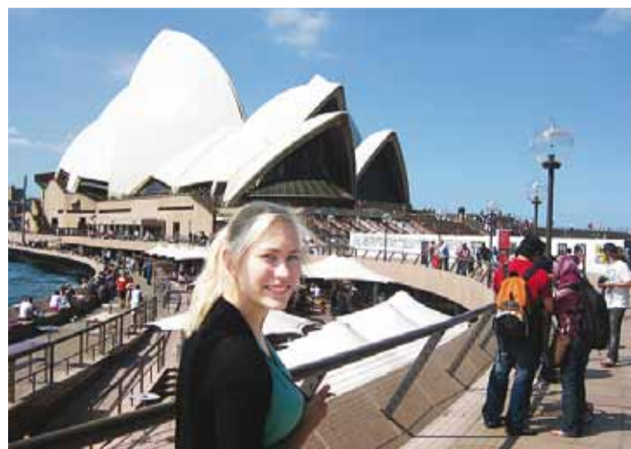
Sydney kuulsaima vaatamisväärsuse – Ooperimaja juures.

berra. Kõik need linnad asuvad lõunarannikul, kus on talviti külm ja kõle, aga lund siiski ei saja, kuid suvel on soojem kui Eestis.