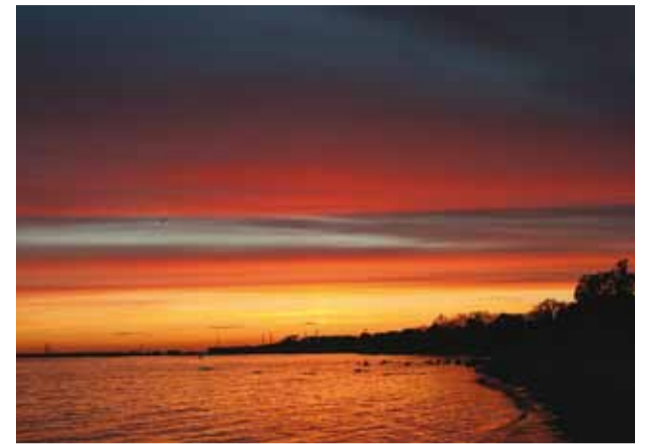
Õhtu Miidurannas.