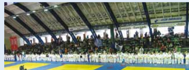
Judoturniir Tallinn Cup 2010 Kalevi Spordihallis.

Laupäeval, 20 veebruaril toimus Kalevi Spordihallis Tallinn Cup 2010 rahvusvaheline judoturniir D, C, B vanuseklassidele, millest võttis osa üle 400 judoka.