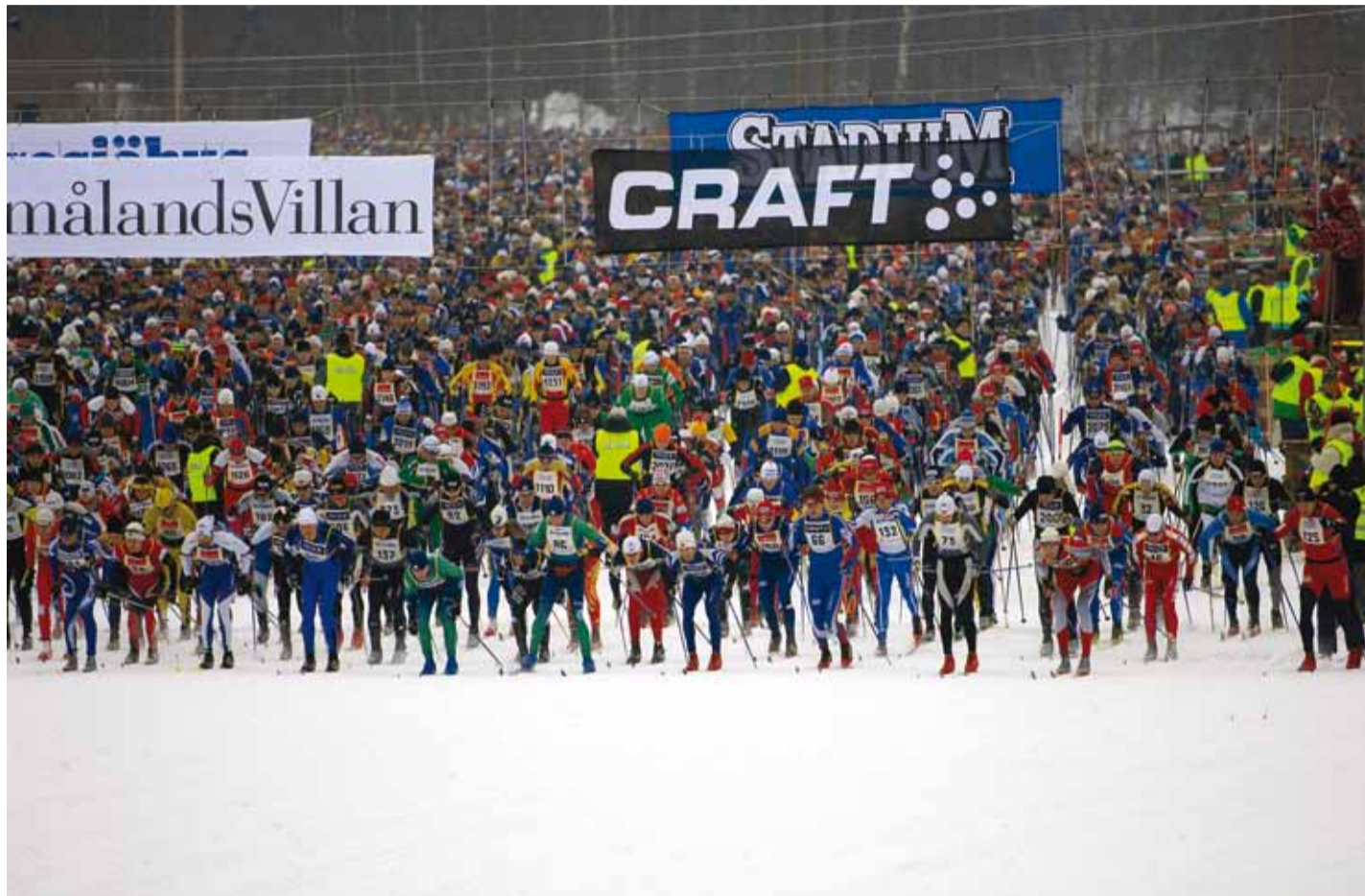
Hetk pärast Vasaloppeti starti.

Mis aga toitumise puutub, siis selgus, et üheks maratoni-meeste lemmikuks näis olevat õlu, seda nii sõidueelsetel päevadel kui ka taastusvahendina