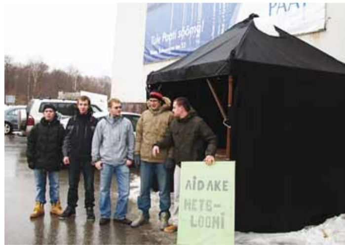
Viimsi noored koguvad annetusi metsloomade toitmiseks.

Käesolev talv on üle paljude aastate olnud tõeliselt lumerikas. Paksu lume tõttu on hätta jäänud metsloomad. Jahimeestelt saabunud teadete järgi on mõnel pool asi juba nii hull, et metsloomad on kogunenud lausa karjadesse ega lahkugi enam umbes kahesaja meetri raadiuses toitumiskohtade ümber. See omakorda on loonud kiskjatele ülisoodsa