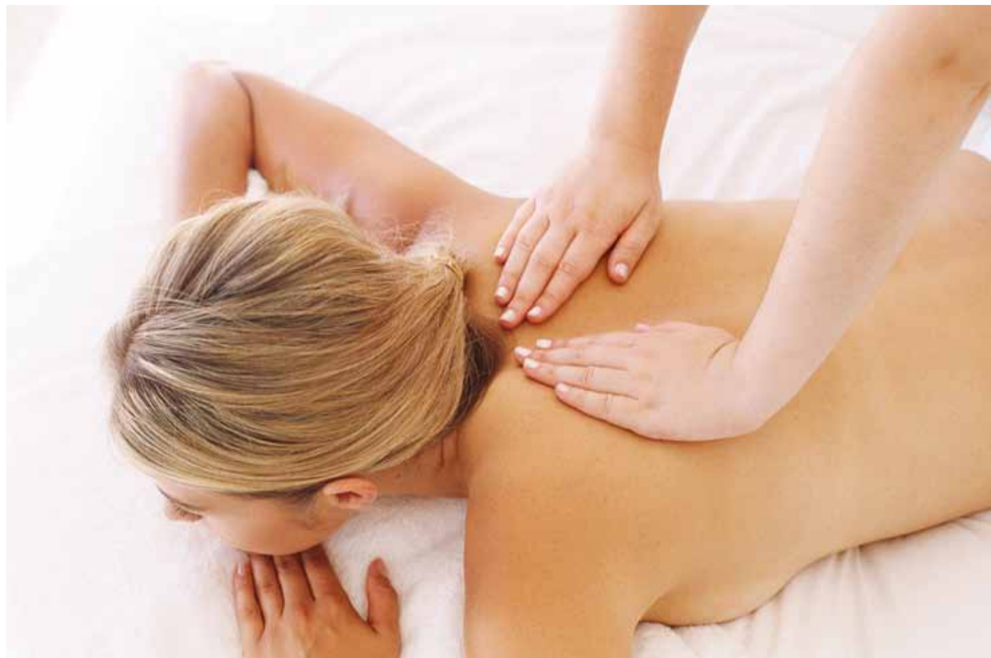
Silitamisel on tervisele sügav mõju.

Üks väga lihtne seaduspärasus kehtib veel. Inimese verevarustus toimib kahel põhimõttelisel tasandil: kas “võitle ja põgene” või “kasva ja arene” režiimil. Verevarustus võib olla