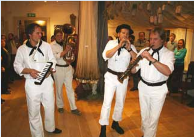
VLÜ kontserdiga koguti 32 000 krooni.

6. märtsil toimus Rannarahva Muuseumis heategevusõhtu Keri saare toetuseks, kus selle väikese saare saare sõpru ja toetajaid tantsutas Väikeste Löötpillide Ühing.