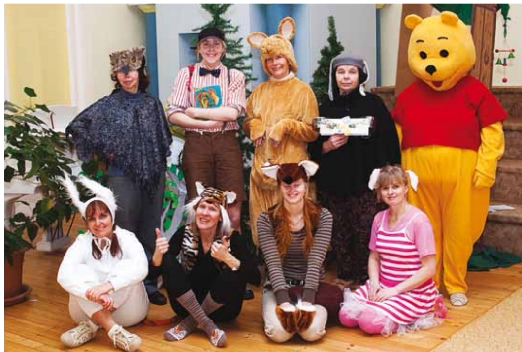
Piilupesa sünnipäevalised.

on üks mõistlik olevus, kes oskab kirjutada isegi sõna TEISIPÄEV, ehkki ta teeb selles mitu viga... Jah, tema on küll tark, tema poole lähengi. “Öö-