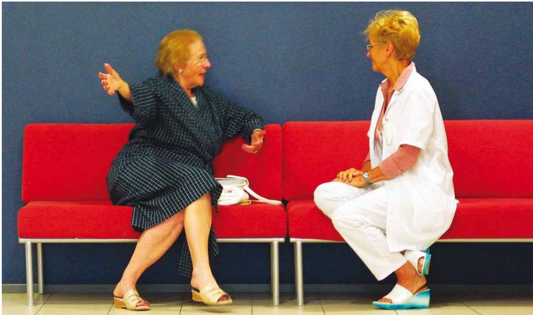
Enne raviprotseduure on soovitatav taastusraviarstiga nõu pidada.