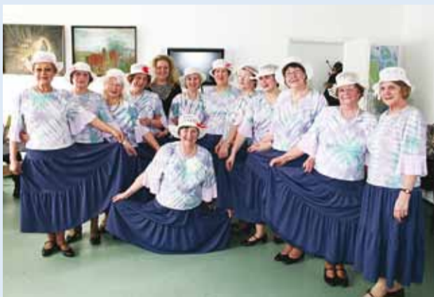
Seeniortantsurühm Kobarake.

Randveres on senioridel traditsiooniks saanud pidupäevade ja sünnipäevade tähistamine. Nii ka seekord naistepäeval.