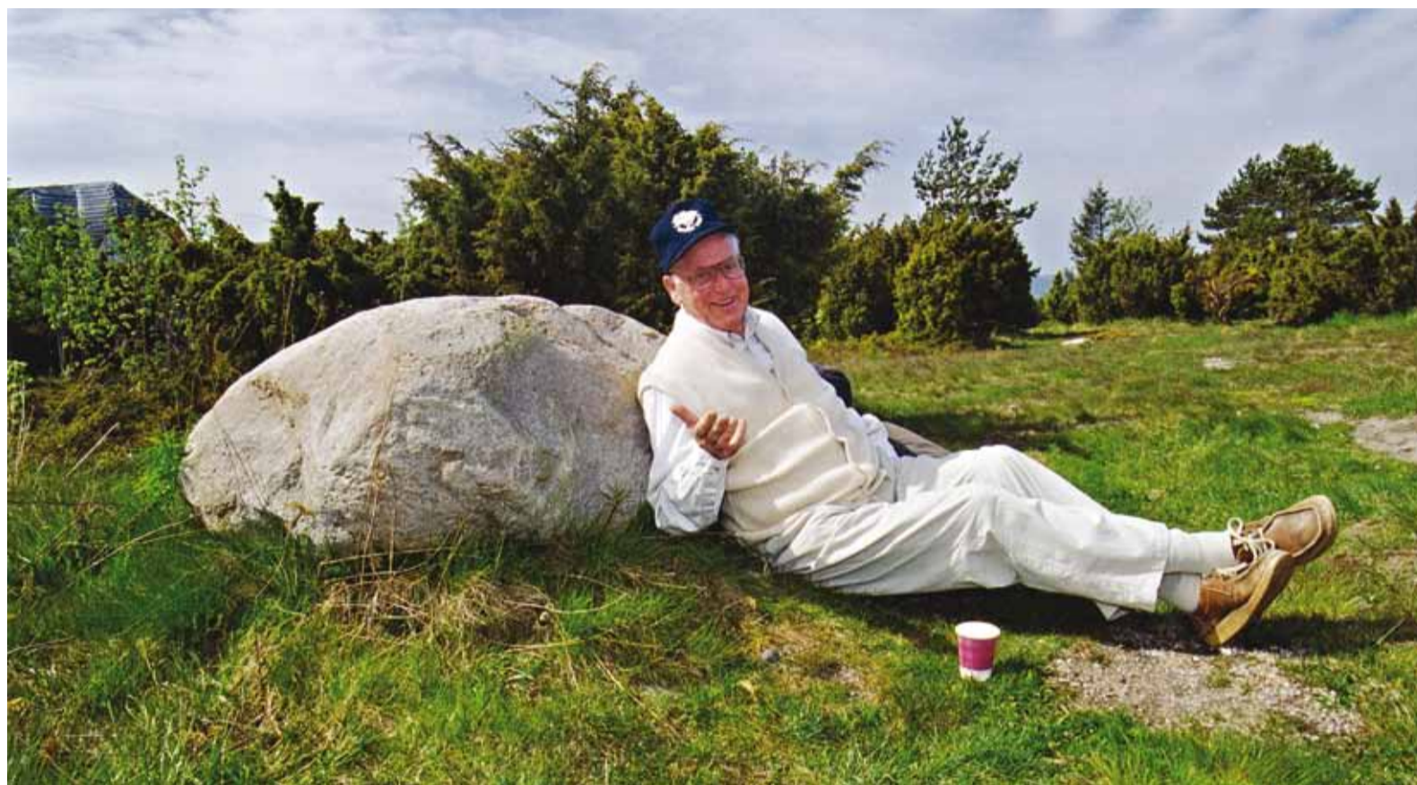
Lennart Meri tahtis end siduda mere ja Viimsiga.

Oma mõtte saab alates 4. märtsist www.teemeara.ee lehel talguna ära registreerida, kus see peagi ka teistele nähtavaks muutub, ning asuda talgupäeva ette valmistama.