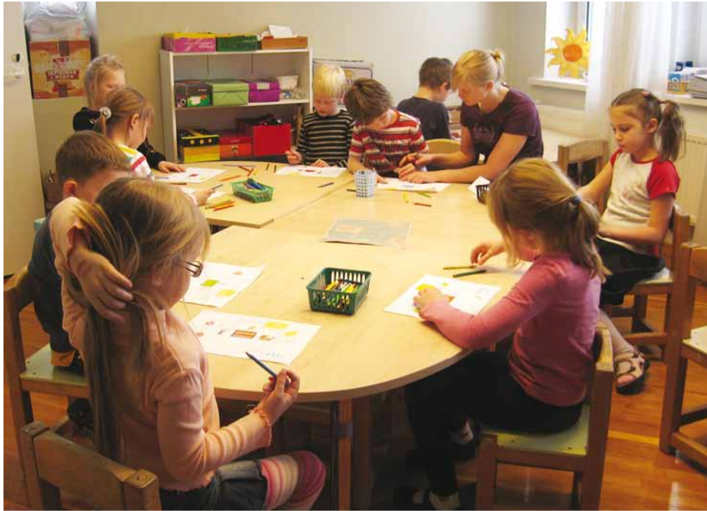
Astri tee eramus on ruumi mitmel tasapinnal. Nii saavad suuremad lapsed õppides omaette olla.

“Loodan väga, et Piilupesa rühmad – nii lapsed, töötajad kui ka lapsevanemad – kohanevad uut moodi eluga kiiresti. Oleme teinud uued ruumid lasteaia jaoks sobilikeks ning võimalikult mugavaks. Ostsime asendusruumidesse uued voodid, kapid ja muu lasteaiale vajaliku sisustuse. Samuti rajame hoonete aiaga ümbritsetud hooivõttes mänguväljakud lastele. Ka toitlustus on korraldatud: Piilupesa rühmadele organiseeritakse kolm korda päevas soe toit Karulaugu Lasteaia köögist,” lausus Urve Palo.