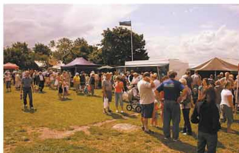
Kalaturu järjekorrad olid pikad.