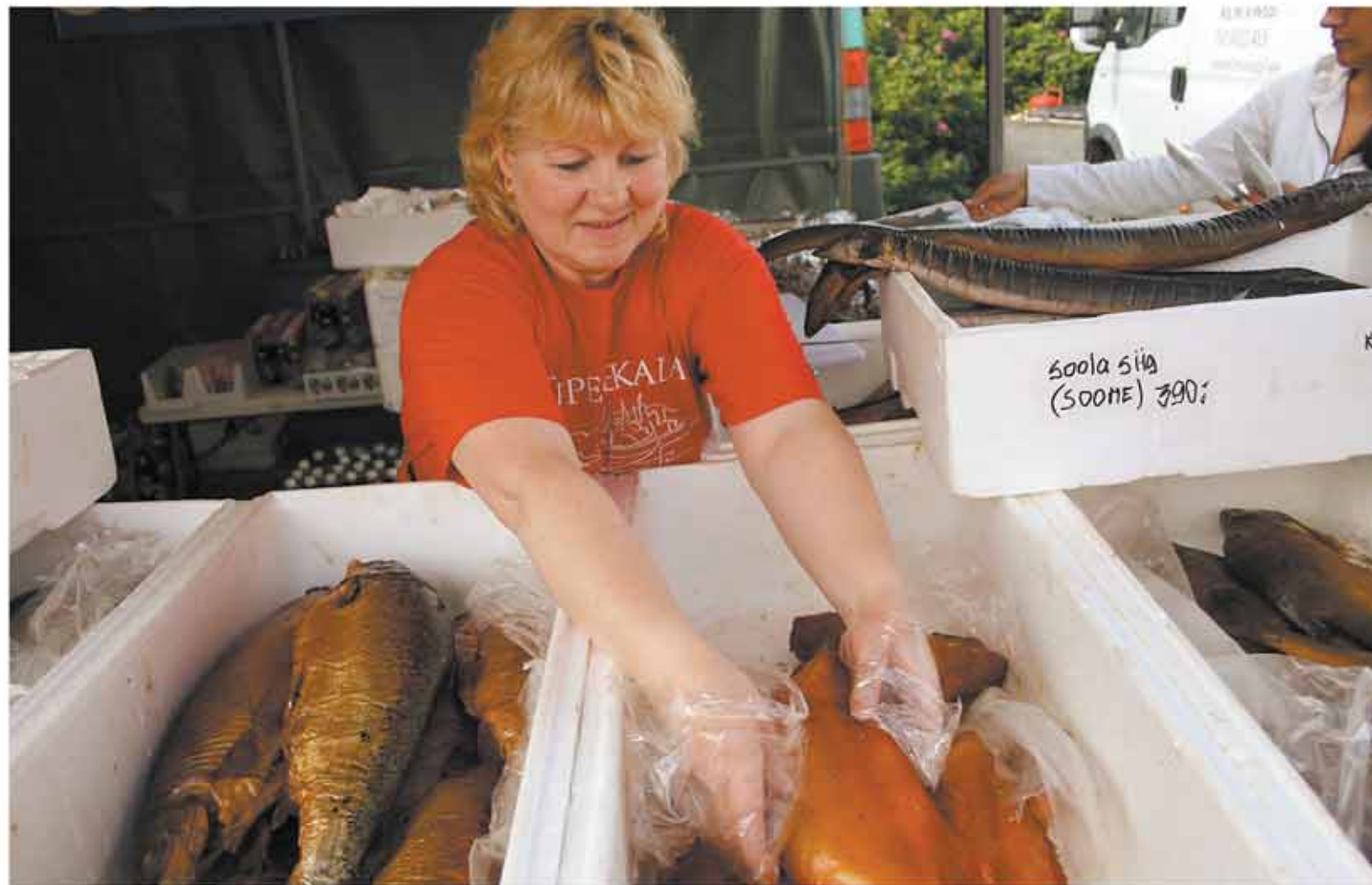
Kalamüüjad pidid koguaeg kala letti laduma, sest ostjaid muudkui tuli ja tuli.