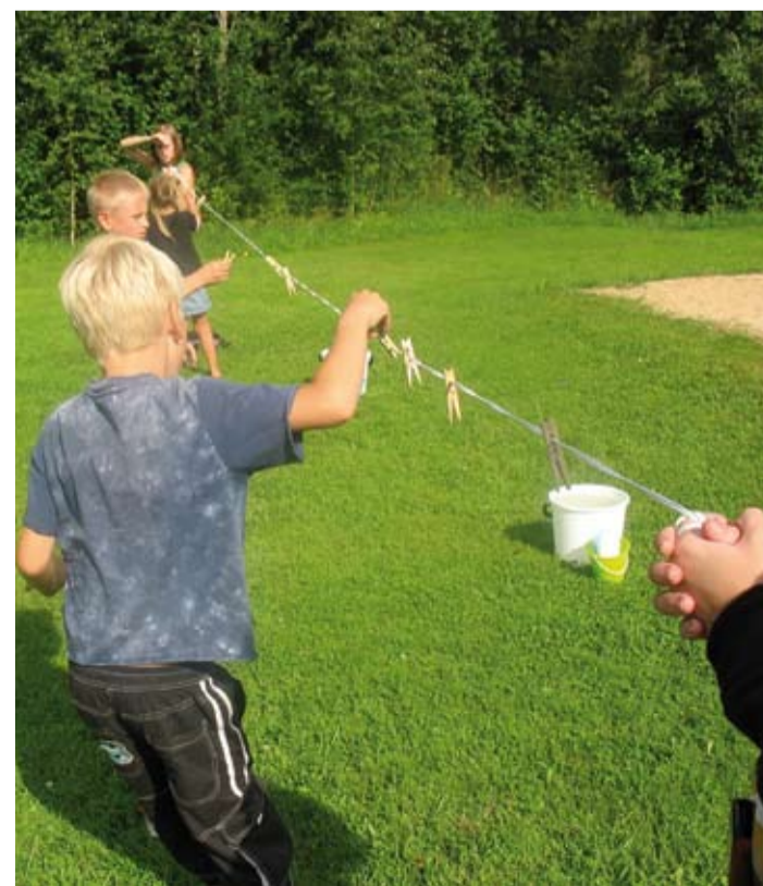
Võistluspäev Venevere suvelaagris.