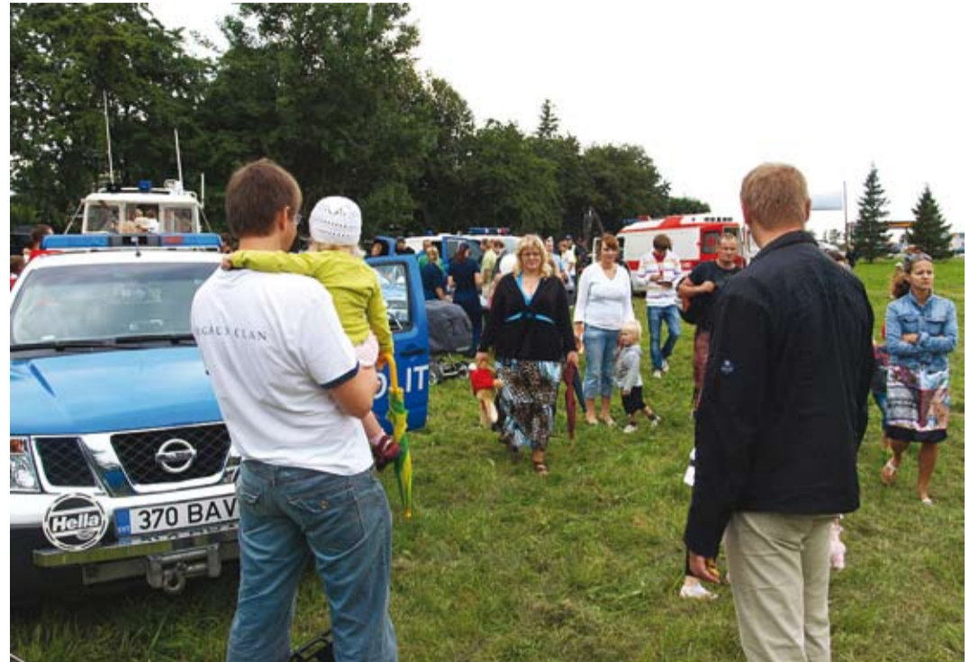
Hoolimata väikestest vihmabinatest tuli rahvast kokku arvukalt.

KSH aruande avalik arutelu toimub 12.10.2009 algusega kell 16 Viimsi Vallavalitsuses.