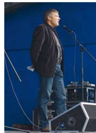
Turvalisuspäeva avas sise- minister Marko Pomerants.

Turvalisuspäeva avas Eesti Vabariigi siseminister Marko Pomerants. Minister rõhutas oma avakõnes, et kodaniku- ühiskonnas algab turvalisus eelkõige meist endast ja oma hoiakutest kogukonna liikme- te vastu. Turvalise riigi, ko- gukonna ja kodu saab tagada vaid politsei, päästeameti, kiir- abi, omavalitsuste ja kodanike vahelises koostöös.