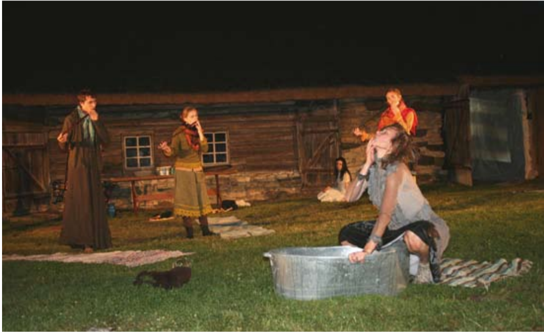
Kingu talu õuel toimunud tantsuetendus "Omaenese ukse".