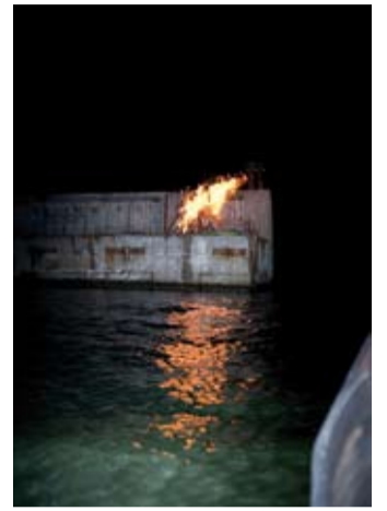
Muinastuli süttis ka kunagise allveelaevade tankimise platvormil, reidikal Miiiduranna sadama all.

Rannarahva Koda tuletöimikonna poolt tänan kõiki, kes leidsid sel õhtul tee mere