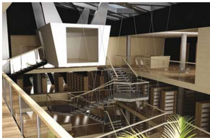
Mustade plaatidega kaetud raamatukoguhoonest kõrgub aatrium.

moodustab helistuudio, milles on mitu salvestuskabiini.