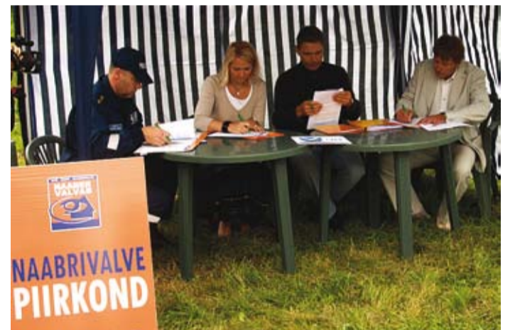
Turvalisuspäeval toimus ka Heldri naabrivalvepiirkonna lepingu allkirjastamine.