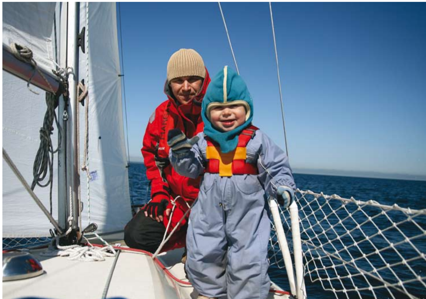
Lõbusad meremehed teel Naissaarele.