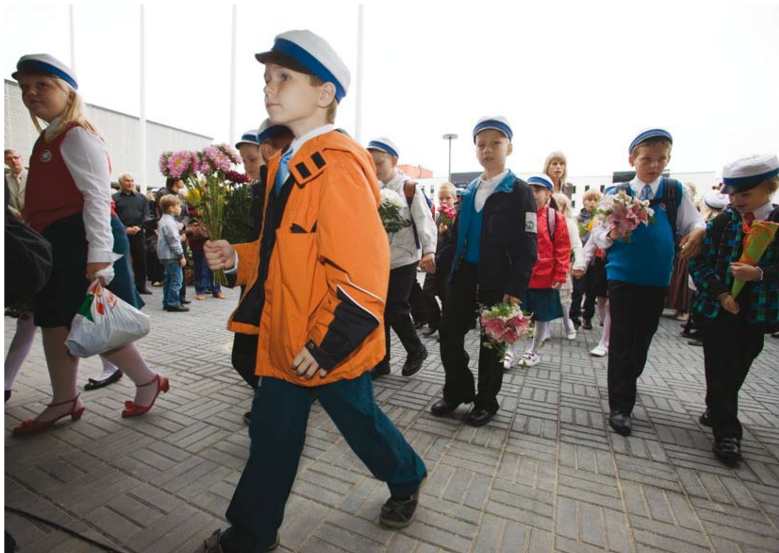
Lähen uude koolimajja, uljalt ja uudishimulikult!