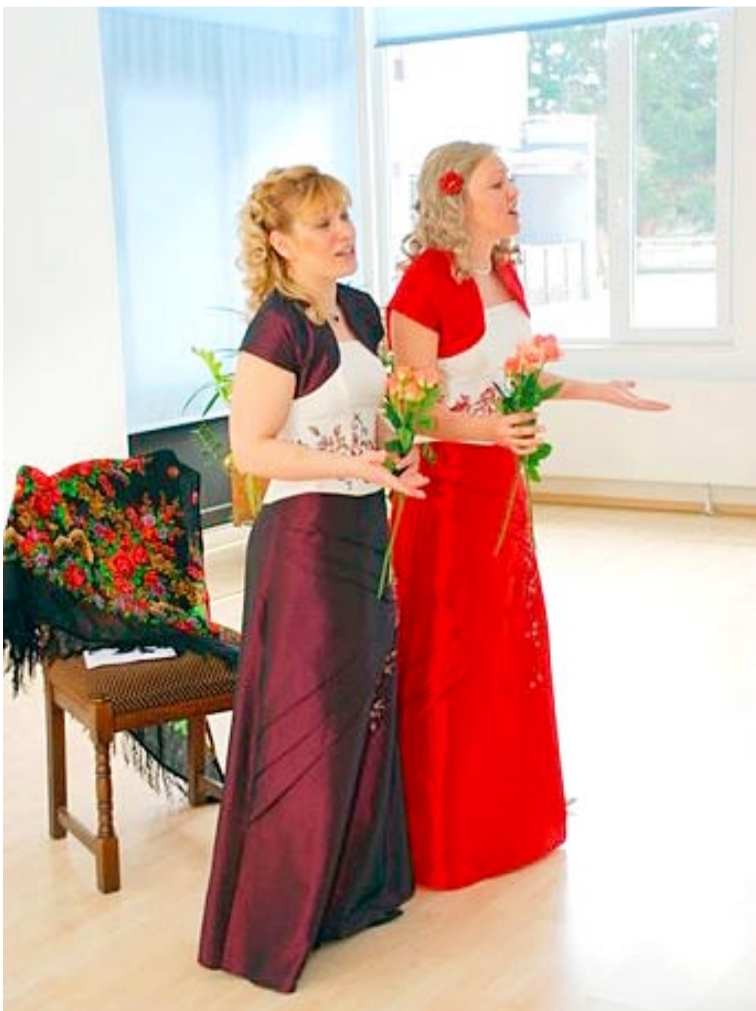
Peomeeleolu lõi duett Vene Romansi Saladus.