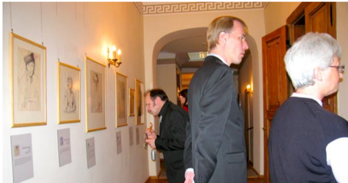
Näitus on avatud.