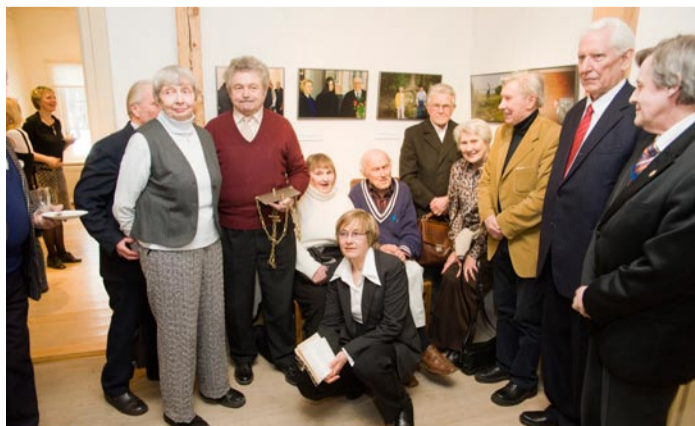
Ka pidulikul üritusel võib end vabalt tunda.