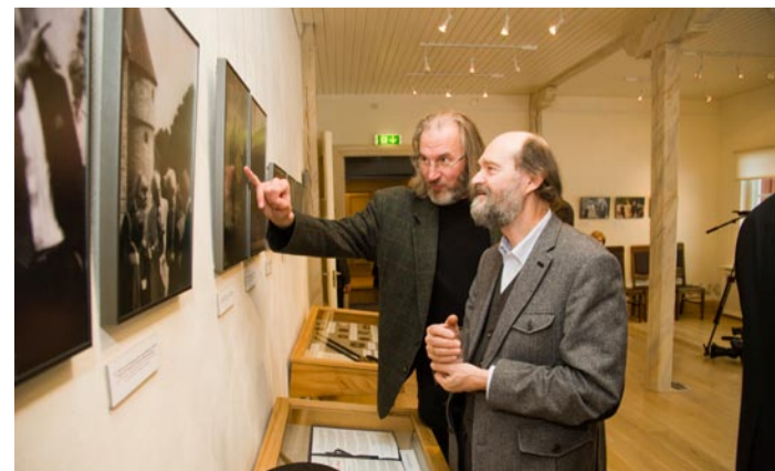
Tõnu Kaljuste ja Arvo Pärt on fotol midagi tuttavat leidnud.