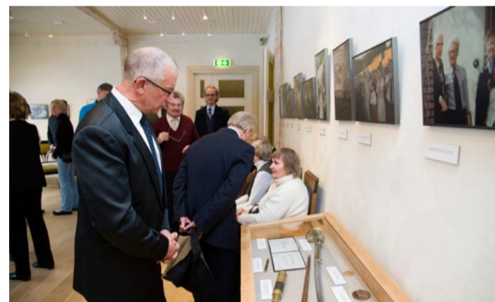
Presidendi asjade ja fotode vaatamine pani mõtlema.