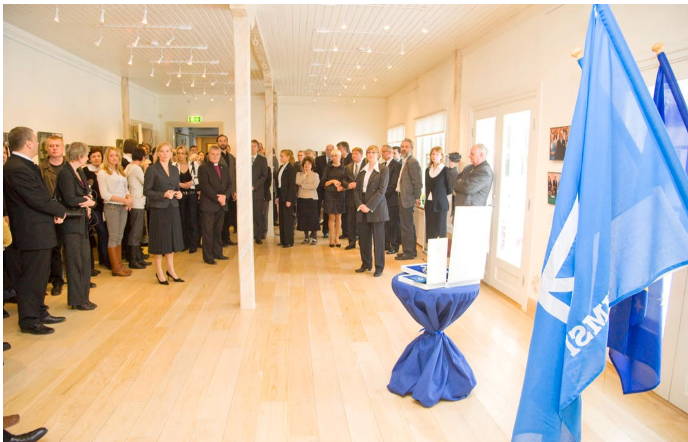
Näituse avamisele oli kogunenud arvukas ja väärikas seltskond.