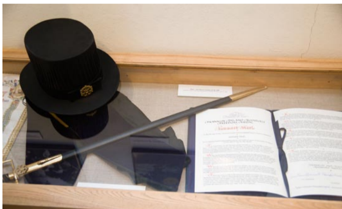
Presidendi mõök ja kübar.