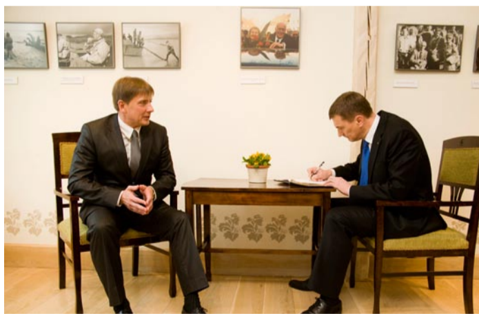
Vallavanem vaatab, kuidas peaminister külalisteraamatusse kirjutab.