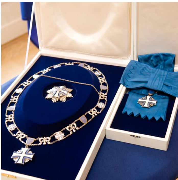
Presidendile antud Maarjamaa Risti teenetemärgid.