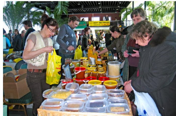
Pole paremat paika kui meepäevad, et saada ülevaadet, kui suures valikus on Eestimaa mett ja meetooteid.

Ostjaid jagus ja korraldajad olid rahul. Korraldas Eesti meetootajate ühendus. Meepäe-