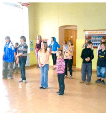
Jumpstyle'i õpe Juuru laululaagris.

Tehi sporti ja õpiti matkatarakusi. Kuna see oli salgajuhtide koolituslaager, siis pidid Püüsi kodutütred viima läbi näidiskoonduse ja organiseerima mänguõhtu. Koonduse teema oli plakati koostamine ja kodutütarde vabaajariietuse eskiiside joonistamine. Individuaalvõistluses pälvisid Püüsi kodutütred auhinnalised kohad.