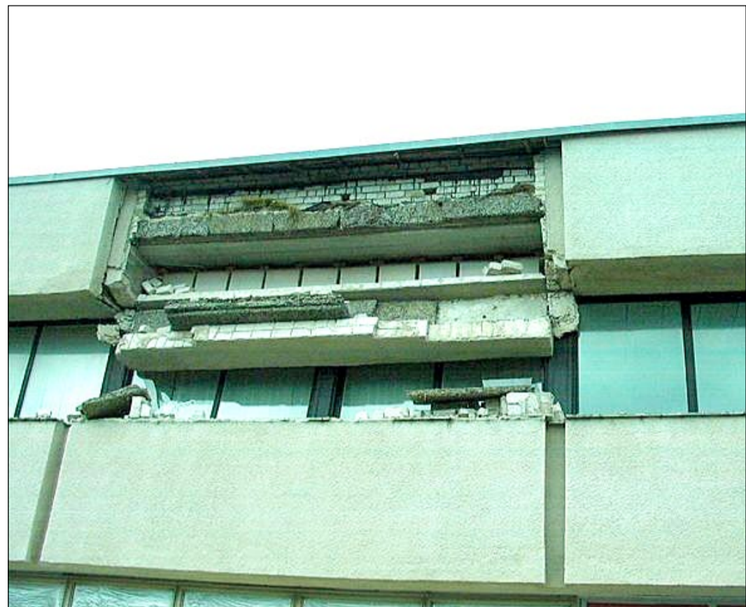
Kaluri tee 3 hoone varisenud sein.

Kolmapäeval, 30. aprillil kell 18 Viimsi huvikeskuses, Nelgi tee 1 Helder Vaabeli 80. sünnipäevale pühendatud