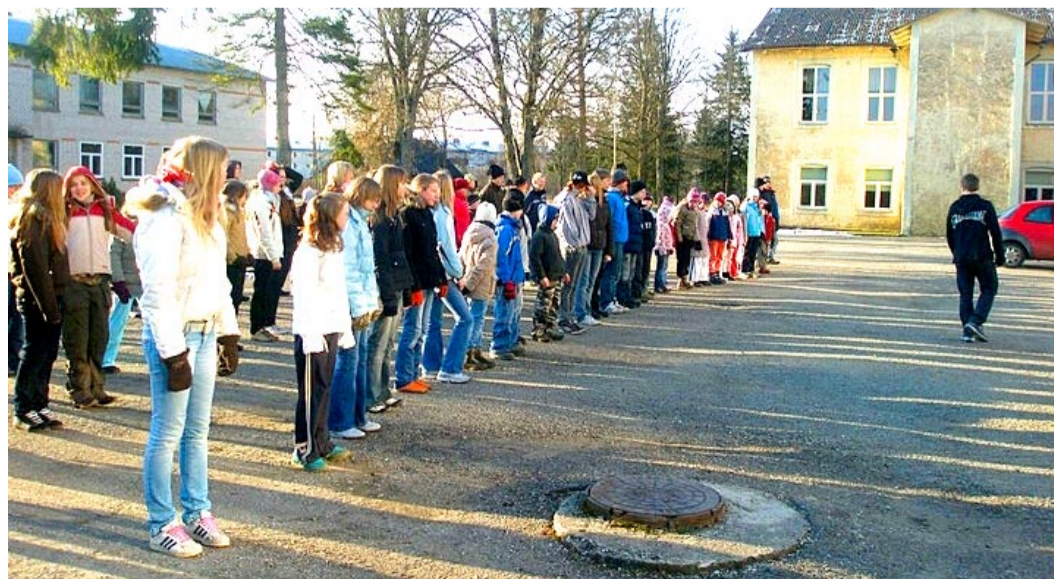
Laululaagri hommikune rivistus Juurus.